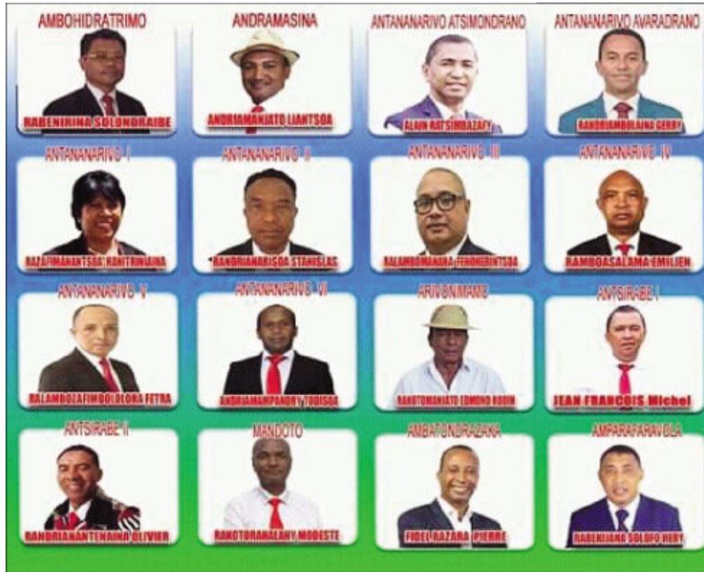
Ireo depiote TIM, mpikambana ao amin'ny Antenimierampirenena vaovao.