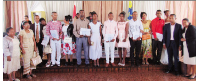
Ireo vita fisoratam-panambadiana faobe tao amin'ny Boriboritany voalohany.