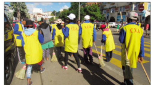
Ny fanadiovana faobe nataon'ny mpanadio tanàna rehetran'ny kaominina.