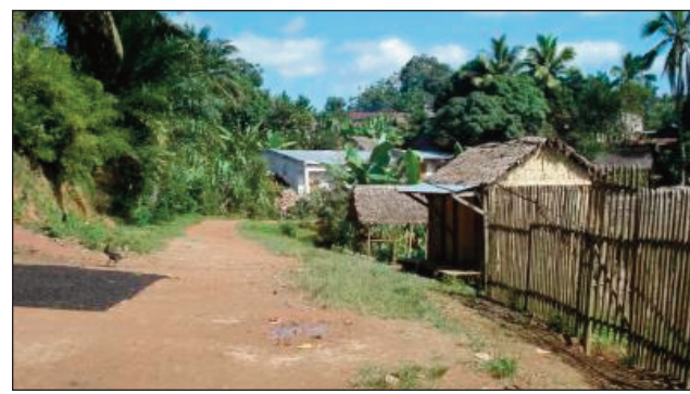
Ny fahasimban'ny lalana any Vavatenina.