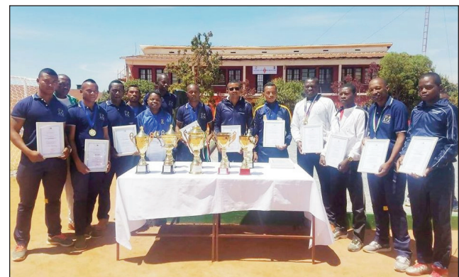
Ireo mpilalao nahazo mari-pankasitrahana ao anivon'ny COSFA.