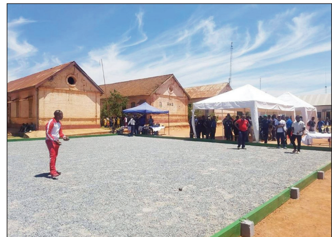
Kianja anisan'ny notokanana teny Ampahibe ny faran'ny herinandro teo.