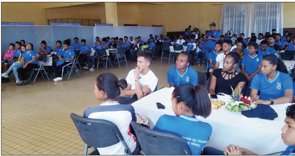
Ireo tanora nisitraka fiofanana tetsy amin'ny ANS Ampefiloha.