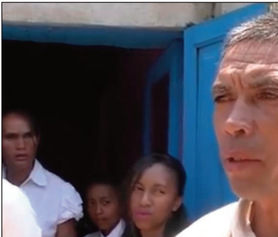
Ny sasany amin'ny taranak'i Dada Roger.