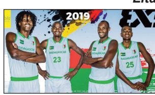
Ireo mandrafitra ny ekipam-pirenena Malagasy eo amin'ny basket-ball 3 x 3.

Tafaktra hiady ny laharana faha-3, hahazoana ny medaly alimo ny ekipam-pirenena Malagasy eo amin'ny fanatanjahantena basket-ball 3 x 3, na ny basket lalaoavin'ny olona 3, atao any Ouganda amin'izao fotoana. Teo amin'ny lalao ankatoky ny famaranana, Egipte handresy an'i Madagasikara tamin'ny isa 21 no ho 11, teo amin'ny lalao ampahefadana kosa, Madagasikara nampiondrika an'i Botswana tamin'ny isa 13 no ho 10. Manana ny maha-izy azy ny Malagasy amin'ity basket-ball 3 x 3 ity, ka heverina fa hahazo medaly amin'izao fiadiana ny amboaran'i Afrika amin'ity taranjam-panatanjahantena ity izao.