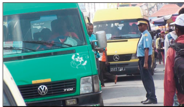
Miasa ny mpiasan'ny CUA, ho fanalalana ny fifamoivoizana.

Fandrindrana ny fifamoivoizana eto andrenivohitra, mbola maro amin'ireo taxibe no tsy manaja ny bokin'andraikitra, ary misy mihitsy ireo minia mandika izany amin'ny tsy fanarahana ny fitsipika mifehy ny lalana, sy ny toeram-piantsonana, ny fanaovana vodihazo amin'ny arrêt iray, ny fanalana sy fampidirana olona anaty arabe. Ireo no anisan'ny antony mbola mampikorontana ny fifamoivoizana eto andrenivohitra araka ny nambaran'ny teo anivon'ny kaominina Antananarivo Renivohitra (CUA). Manao ny ezaka rehetra ny tompon'andraikitra amin'ny fandrindrana ny fifamoivoizana, manentanana ireo taxibe amin'ny fanajana ny bokin'andraikitra, anisan'ny imasoana koa amin'izao fotoana izao ny fandaminana ny fivarotana amoron-dalana amin'ny alalan'ny fanetsehana ireo agent d'assainissement sy ny fandrindrana ny fifamezivezen'ny