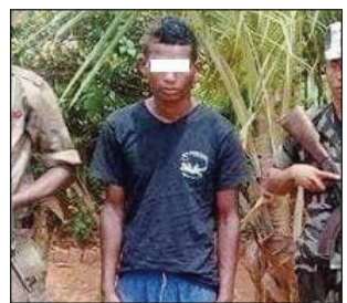
Ilay dahalo tratra nangalatra omby tany Tsiabafositra Maevatanana.

Miara-misalahy amin'ny fokonolona amin'ny ady amin'ny asan-dahalo sy ny halatra omby ny miaramila miasa any amin'ny faritra Betsiboka iny. Nitrangana halatr'omby tao Ambarimanta I, fokontany Anosimpotaka, Kaominina Tsiabafositra, distrikan'i Maevatanana ny faran'ny herinandro teo. Omby efa ho 40 mahery no nalain'ireo dahalo ary tsy vitan'izany, fa nandroba entana maromaro