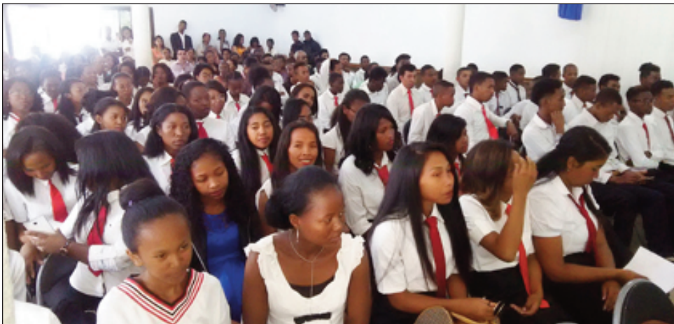
Ireo mpianatra, nahavita fiofanana tamin'ny informatika.