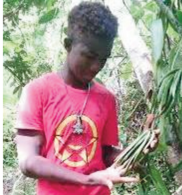
Mahavokatra lavanila be ny any Andrafainkona.

Ny tanànan'Andrafainkona, any amin'ny distrikan'i Vohemara, faritra Sava indray no Mahaliana eto amin'ny gazetinao androany. Renivohitry ny kaominina Andrafainkona ity tanàna ity. 740 m ny haavony miohatra amin'ny ranomasina. Tantsaha mpamboly sy mpiompy ny mpoina any. Anisan'ny tena vokatra be any an-toerana ny vokatra fanondrana lavanila. Mpiompy akoho amamborona koa ny any Andrafainkona.