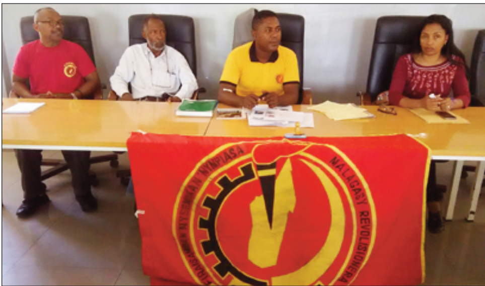
Ireo mpitarika ny FISEMARE.