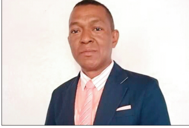
Ny ben'ny tanànan'ny kaominina Ranomafana Brickaville.