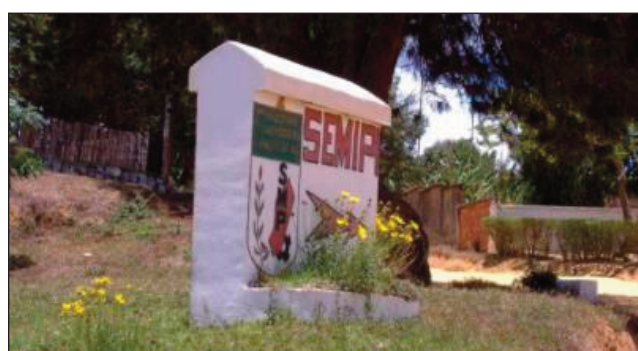
Ny SEMIPI any Beravina Fianarantsoa.

Fantatra izao fa misokatra ny fifaninanana hidirana ho mpianatra any amin'ny Sekoly Miaramilam-pirenena na ny SEMIPI. Araka ny filazana navoakan'ny Etamazaoron'ny Tafika dia ny 21 Septambra, ka hatramin'ny 01 Oktobra ho avy izao ny fifaninanana hiditra ao amin'ny Sekoly Miaramilam-pirenena na SEMIPI. Misy ny sampana fampianarana ankapobeny ary ny sampana fampianarana teknika. Toy izao ny fepetra ho an'ny mpifaninana: 14 ka hatramin'ny 17 taona, manana marim-pahai-zana BEPC na kilasy fahatelo. Vita fizahana ara-pahasalamana. Ireto avy