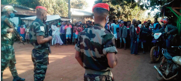
Sakoroka tany Farafangana omaly vao maraina.

Sakoroka vao maraina, na nikorontana vao maraina ny tany Farafangana renivohitry ny faritra Atsimo Atsinanana omaly. Andaniny ny mpitandro filaminana, ankilany ny mponina tao amin'ny Fokontany Andranomakoko. Ny zava-nisy, maty voatifitry ny jiolahy afak'omaly alina ny sefo Fokontanin'ity Fokonatany Andranomakoko ity. Nisy ny olona voasambotry ny