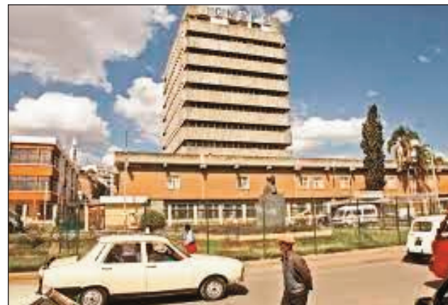
Ny CNAPS etsy Ampefiloha.