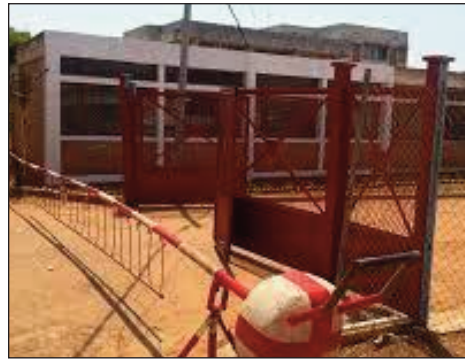
Ny Ivon-toerana fanaofanana arak'asa INPF eny Ivato.

Manomana fanaofanana arak'asa ho an'ireo tanora eny Ivato distrikan'Ambohidratrimo sy ny manodidina, ny kaominina Ivato sy ny INPF (Institut National de Promotion Formation). Misy ny fanambarana avy amin'izy ireo mahakasika izany: izay nisoratra anarana momba ny fiofanana arak'asa izay karakarain'ny Kaominina sy ny INPF, dia amin'ireto daty voatondro manaraka ireto no hanatanterahana ny fanafanana, mba hahafahan'ireo tanora mivao-tena noho ny fiantraikan'ny va-