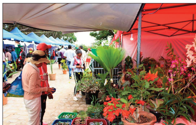
Ireo mpitsidika ny hetsika: « Festival des Jardins », tetsy amin'ny AFT Andavamamba ny herinandro teo.

Hetsika momba ny zaridaina, na Festival des Jardins natao tetsy amin'ny AFT Andavamamba nandritra ny hateloana ny herinandro lasa teo, nahatratra 5000 teo ireo nit-sidika izany hetsika izany nandritra ireo fotoana ireo. Tanjona tamin'izao hetsika izao ny fanehoana ny fikojana ny zaridaina, sy ny fikojana ihany koa ny tontolo iainana. Teo amin'ny 40 teo kosa no isan'ireo tranoeva nanao ny fampirantiana ireo voninankazo samihafa, sy ireo karazan-kazo volena eny anjaridaina. Anisan'ny nia-vaka sy nahaliana ny maro ny « bonsai », karazan-kazo fohy sy fonentana. Ankoatr'izany, nisy