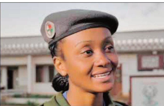
Polisy vavy, mandray anjara amin'ny sehatry ny filaminana koa eto Madagasikara.