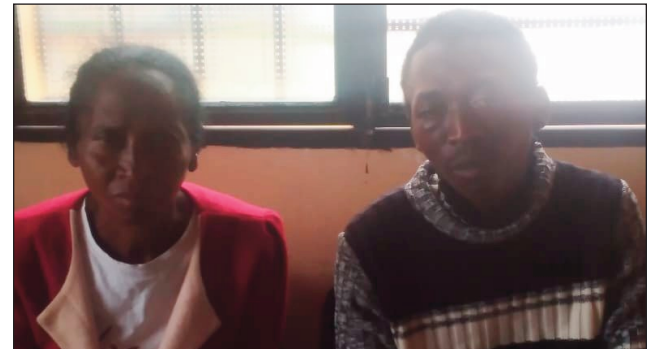
Bona sy ny fianakaviany tao amin'ny zandary.