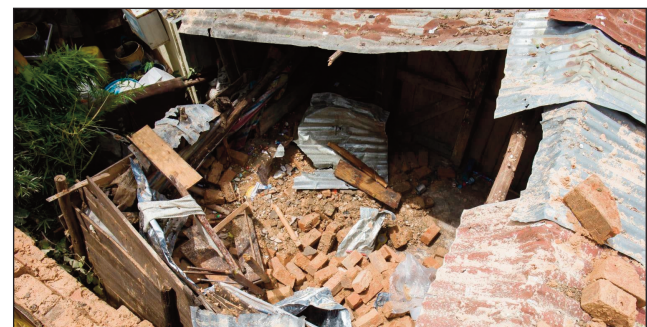
Ilay tranon'olona hafa nirodana trano iray hafa, teny Manjakamiadana.