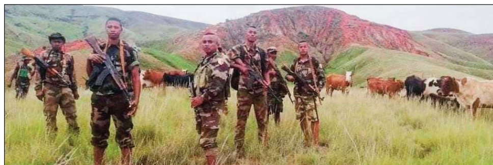
Ireo miaramila tany Tanimbaritsara Tsaratanana, sy ireo omby azon'izy ireo tany amin'ireo dahalo.