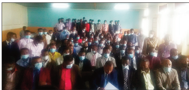
Ireo avy amin'ny firaisan'ny mpitandrina, ao amin'ny Fiangonana Jesosy Mamonjymanerana ny Nosy.