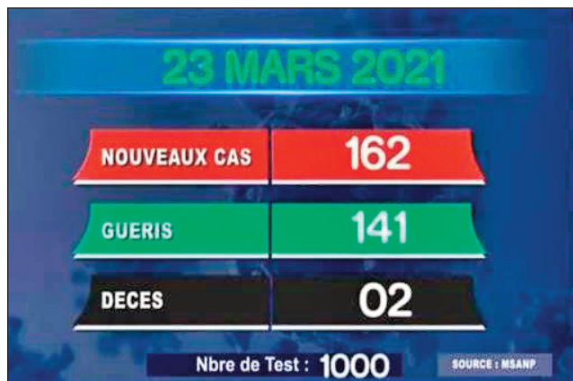
Tarehi-marika farany momba ny covid19 teto Madagasikara.

Tarehi-marika farany momba ny valanaretina coronavirus: 162 ny tranga vaovao, niampy 2 ny olona matiny teto Madagasikara ny 23 martsa 2021 lasa teo. 162 tranga vaovao hita tamin'ireo 1000 nanaovana fitiliana teto Madagasikara ny 23 martsa 2021 : 84 Analamanga, 21 Atsinanana, 11 Diana, 10 Boeny, 15 Vakinankaratra, 8 Menabe, 8 Analanjirofo, 1 Ihorombe, 1 Melaky, 3 aty Sofia.