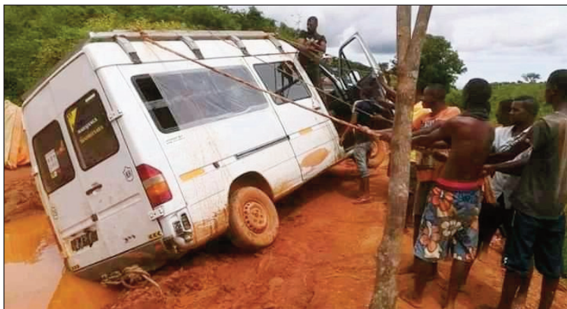
Ny fijalian'ireo mampiasa ny RN32 amin'izao fotoana.