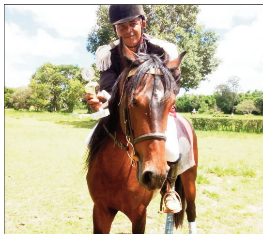
Mpitaingin-tsoavalin'ny zandarimariam-pirenena, nahazo ny amboara tamin'ny fifaninanana nokarakarain'ny FMSE.