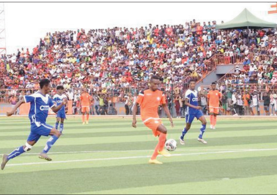
Fihaonan'ny Elgeco sy Five Fc farany teo.

Mbola ny ekipan'ny Five Fc Analamanga ao amin'ny "Conférence Sud", sy ny As Adema ao amin'ny "Conférence Nord", no mbola mitarika an'isa vonjimaika ankehitriny taorian'ny andro faha-6 sy andro faha-8 notontosaina tamin'ny faran'ny herinandro lasa teo iny. Eo amin'ny baolina kitra fifaninanana Orange Pro League 2021. Kianja maromaro no nanatanterahana ny lalao ny faran'ny herinandro teo, tany amin'ny kianja Maoderna Ampasambazaha Fianarantsoa, tany amin'ny kianja Barikadimy Toamasina, teny amin'ny Elgeco Plus Stadium teny amin'ny By-Pass, ary tany amin'ny kianja Rabemananjara tany Mahajanga.