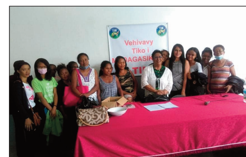
Ireo vehivavy TIM, nandray ny fanampiana ara-bola tetsy Bel'Air.