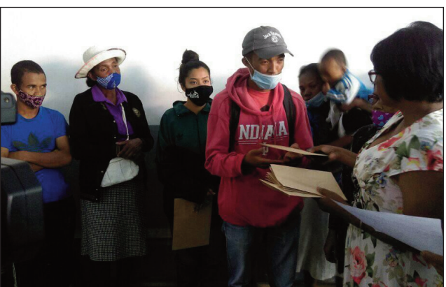
Ny fanolorana ny valopy ho an'ny fianakavian'ireo voafonja 12 mianadahy, tetsy Bel'Air omaly.