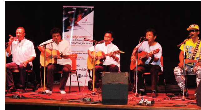
Ny hetsika Vazo Miteny, tetsy amin'ny AFT Andavamamba ny faran'ny herinandro teo.