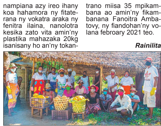
Mpikambana ao amin'ny kooperativa Fanoitra, mpiara-miasa amin'ny orinasa Ambatovy.