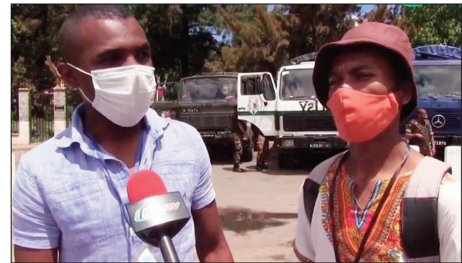
Ireo mpanao gazety mirahalaha voasambotra teny Ambohitato ny sabotsy teo.