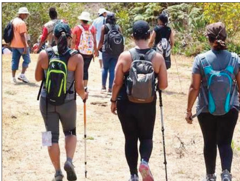
«Randonnée» teo aloha, nokarakarain'ny Ortana.

Hanomboka ny sabotsy 13 martsa izao ny « randonnée » na ny fizahantany laroana dia antongotra sy hazakazaka madinidinika ho karakarain'ny Ortana, na ny Ofisim-paritry ny Fizahantany amin'ny faritra Analamanga amin'ity taona 2021 ity. Any Ambatomena Vakinimanana, distrikan'i Manjakandriana no hisantarana ny hetsika amin'ity taona ity. Ankoatran'io any Ambatomena io, mbola hisy toerana miisa 17 hafa hanatanterahan'ny