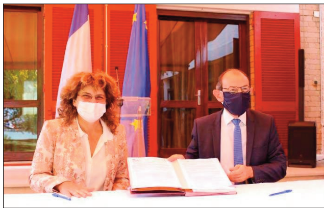
Fifanoavan-tsonia, ho fanampian'i Frantsa antsika, any amin'ny faritra Atsimo.

ana toeram-pitsaboana azo afindra maneran'ny Faritra Atsimo ary hanamafisana amin'ny fomba maharitra ny fahafahan'ireo tokantrano marefo ahazo fahafaham-po amin'ny fivelomany, manatsara sy manamaro karazana ny fiarovana ara-tsakafony amin'ny alàlan'ny fampiroboroboana ireo vondrom-behivavy. Hitondra tombontsoa mivantana ho an'ny olona maherin'ny 11 000 izy io, ao anatin'izany 10 000 zaza latsaky ny 5 taona mijaly amin'ny tsy fanjarian-tsakafo mahery vaika. 200.000 € ho an'ny Humanité et Inclusion (HI). Ny tanjon'ny tetik'asan'ny ONG "Humanité et Inclusion" dia ny hanome fanampiana aratsakafo vonjy maika ho an'ireo olona manana fahasembanana sy ny ankohonany ao amin'ny faritra Atsimo-Andrefana, mba hampihenana ny loza mety hitranga ara-tsakafo mifandraika amin'ny haintany any amin'ny faritra Atsimo, sady manohana ny tolotra momba ny fahasalamana amin'ny fampihenana ny fahasembanana eo amin'ny ankizy 0 ka hatramin'ny 5 taona mijaly amin'ny tsy fanjarian-tsakafo na tsy fahampian-kanina.