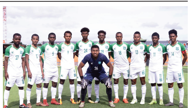
Ny ekipan'ny As Adema tetsy amin'ny By Pass Ambohijanaka.