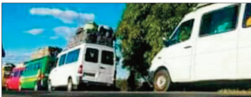
Mpitatitra tsy afaka mandeha, tratan'ny sakana ara-pahasalamana.