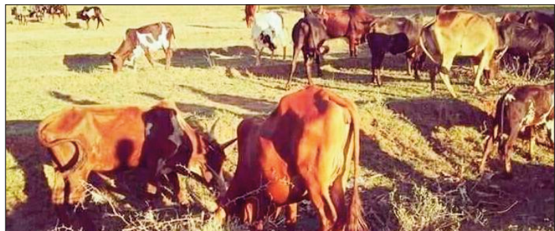
Tandindonin-doza amin'ny aretina FVR ny ombly eto amintsika.