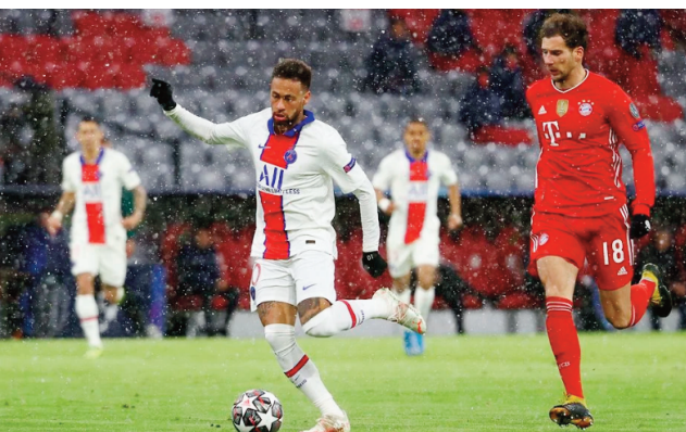
Lalao mandroso teo amin'ny Psg sy ny Bayern.

ny 03383 481 63 ary ny ampitso ihany dia nihaona tamin'i Aina Mpitsabo eny ltaosy.