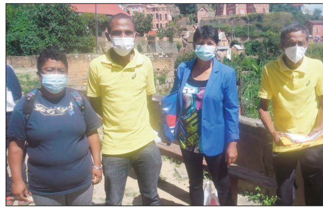
Ireo mpitantana ny ligin'ny volley-ball Analamanga.