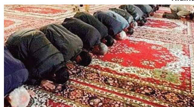
Mpino silamo mivavaka any amin'ny Mosquée.