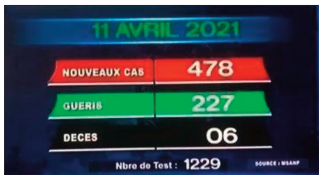
Tarehi-marika faran'ny valanaretina coronavirus teto Madagasikara.

478 ny tranga vaovao hita tamin'ireo 1229 nanaovana fitiliana teto Madagasikara ny 11 aprily 2021 : 369 Analamanga, 2 Atsinanana, 15 Diana, 13 Alaotra Mangoro, 1 Matsiatra Ambony, 3 Boeny, 1 Vakinankaratra, 9 Sava, 8 Atsimo Andrefana, 2 Vatoavavy Fitovinany, 3 Menabe, 9 Bongolava, 5 Analanjirifo, 3 Anosy, 16