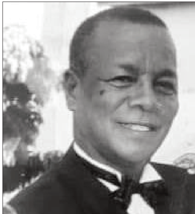
Ny jeneraly Amady Augustin.

Noho ny fahalasanan'ity ray aman-dreny ity izay, naneho fiaraha-miory amin'ny fianakaviany, sy ny fianakavian'ny Polisim-pirenena, ny filoha Marc Ravalomanana: filoha nasionalin'ny antoko Tiako i Madagasikara (TIM), sady filohan'ny vondron'ny mpanohitra RMDM. "Tamin'ny alahelo lehibe no nandrenesana ny fahalasanan'i Jeneraly Amady Augustin, Minisitry ny Filaminam-bahoaka teo aloha ary mpiara-miasa akaiky tokoa. Ny tenako sy ny ankohonako, ny antoko TIM ary ny RMDM dia maneho indrin-