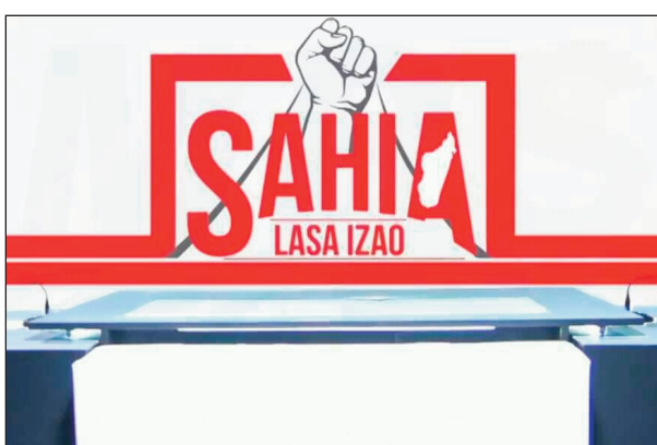
Ny sary famantarana ny fandaharana: Sahia Lasa Izao, vokarin'ny RMDM.