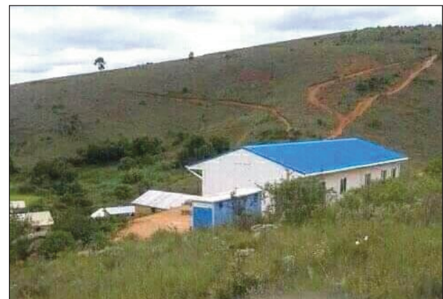
Tanàna any amin'ny distrikan'Anjozorobe, anisan'ny anjakan'ny asan-dahalo.