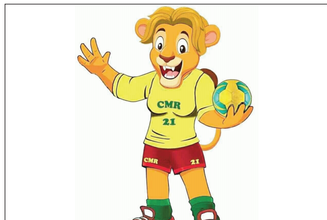
CAN handball 2020-2021.

Raikitra ary nanomboka tamin'ny talata 08 jona lasa teo, ka tsy hifarana raha tsy amin'ny alahady 13 jona 2021 ny fifaninana CAN Handball vehivavy 2021, izay tontosaina any Yaoundé renivohitr'i Cameroun. Ekipa 11 tamin'ireo 12 voatondro mialoha no mandray anjara amin'ny fifaninana, fa nitsoaka an-daharana tamin'ny fotoana farany ny ekipa vehivavy Alzeriana. Toy izao ny vondrona misy an'ireo ekipa 11 ireo : Groupe A : Sénégal, Tunisie, Guinée Conakry, Madagascar. Groupe B : RD Congo, Cameroun, Nigeria, Kenya. Groupe C : Angola, Congo, Algérie, Cap-Vert. I Madagasikara dia sam-