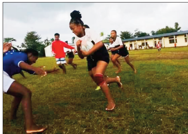
Hetsika fampianarana rugby.

Any Toamasina no hanatanterahana ny hetsika "Festival Get Into Rugby" manaraka eto amintsika eto Madagasikara, ka ao amin'ny kianja Ceg Ratsimilaho Toamasina no hanatanterahana an'izany. Tetika noforonin'ny World Rugby hoentina mampiroborobo ny taranja rugby maneran-tany ny Get Into Rugby, ka anisan'ny manaraka an'izany isika eto Madagasikara. Ankizy sy tanora mahatratra 230 : 50 vehivavy ary 180 lehilahy, no handray anjara amin'ny hetsika. Raha ho an'i Toamasina manokana dia efa tsapa ho mioroboro fatratra ankehitriny ny fampianarana an'ity taranja ity any an-