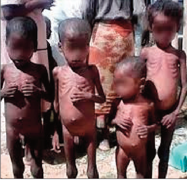
Ankizy tsy ampy sakafo eto Madagasikara.

Tsy ny any Atsimo ihany no iharan'ny tsy fanjarian-tsakafo sy hanoanana, fa saika hita izany manerana ny faritra rehetra eto amin'ny firenena na ambanivohitra na an-drenivohitra. Misy olom-pirenena marobe tsy ampy sakafo sy noana eto amin'ity Nosy ity. Efa ao anatin'ny hanoanana rehefa tsy mahatratra ny fetra farafahakeliny, na ny salanisa ilaina isan'andro amin'ny otriakina ilain'ny vatan'olombelona ny sakafo hohanina. Eo amin'ny 2500 kilaokaloria (kcal) io ilaina isan'andro io. Ny sakafon'ny Malagasy amin'ny ankapobeny anefa dia latsak'io isa io ary tonga hatrany amin'ny 2400 Kcal aza. Lombonany amin'ireo firenena mahantra indrindra sy tsy mandroso izany, satria izy rahateo ao anatin'io sokajy io.