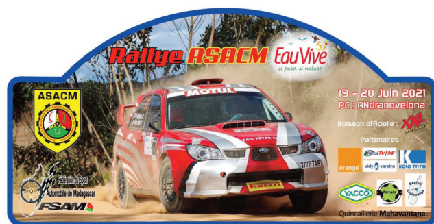
Rallye Asacm Eau Vive 2021.

Ny Asacm "Association Sportive de l'Automobile Club de Madagascar", eo eo ambany fiahian'ny Fsam "Fédération du Sport Automobile de Madagascar", no hisantatra ny fifaninanana rallye Malagasy amin'ity taona 2021 ity, ka hatanterahana ny "Rallye Asacm Eau Vive 2021", izay ho tanterahina eny amin'ny manodidina an' Ambohidratrimo amin'ny sabotsy 19 sy alahady 20 jona 2021 ho avy izao. Eny Andranovelona no hametrahana ny PC