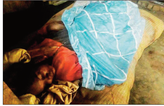
Ilay ramatoa namoy ny ainy, novonoim-badiny.