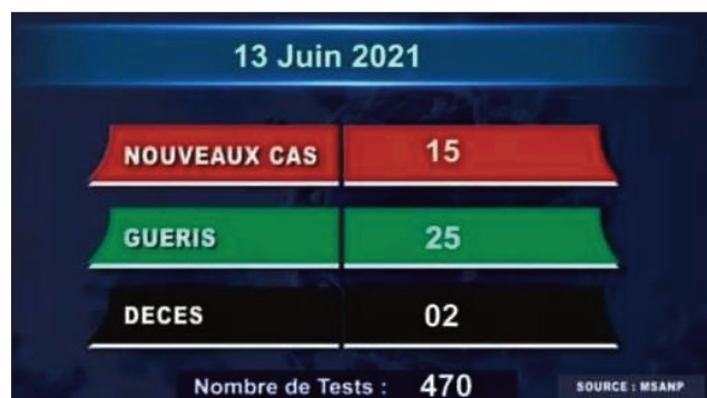
Tarehi-marika momba ny valanaretina coronavirus teto amintsika afak'omaly.