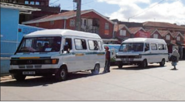
Fiara mpitatitra eny Sabotsy Namehana.

Manome fe-potoana 72 ora, izany hoe 3 andro, ny CUA: kaominina Antananarivo Renivohitra sy ny ATT, sampan-draharaha misahana ny fitaterana an-tanety ny mpitatitra eny Sabotsy Namehana Antananarivo Avaradrano hamaha ny olan'izy ireo. Nitokona avokoa ny fiara fitateram-bahoaka nampitohy an'i Sabotsy Namehana sy eto an-drenivohitra omaly. Noho ny fanafanan'ny kaomina Antananarivo Renivohitra ny fiantsonana eo Analamahitsy no anton'izany. Miteraka olana lehibe ho an'ny mpitatitra sy ny mpanjifa io fanovana io. Manoloana izany dia manome 72 ora ny kaomina Antananarivo Renivohitra sy ny ATT, ny mpitatitra sy ny mpiaro ny zon'ny mpanjifa eny an-toerana, hamaha izany olana izany.