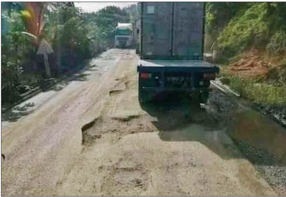
Ny fahapotehana hita amin'ny RN2 amin'izao fotoana.

Potika amin'izao fotoana ny ampahany maro amin'ny lalampirenena faha-2, RN2, mampitohy an'Antananarivo sy Toamasina. Noho izay antony izay, mitaraina ireo mpamily mpampiasa izany lalana izany, izay miteraka lozam-pifamoivoizana matetika. Miteraka ihany koa tsy fandriampahalemana, satria manararao- tra manao ny asa ratsiny ireo jiolahy rehefa mandeha miadana ireo fiara, noho ny faharatsian'ny lalana.