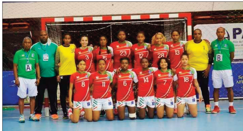
Ny mpilalao Handball vehivavy Malagasy tany Cameroun.