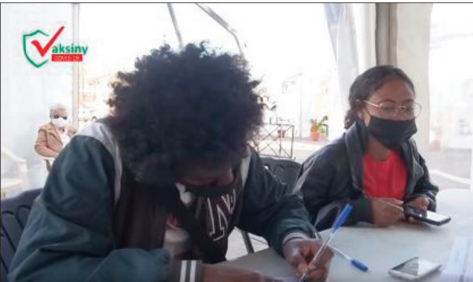
Vita vaksiny covishield Beranto amin'ny Tarika Ambondrona.