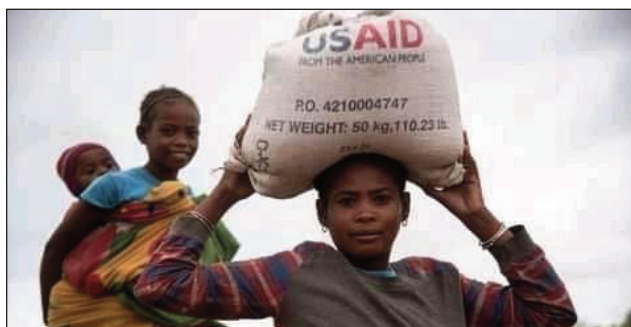
Mpisitraka fanampiana avy amin'ny Amerikana any amin'ny faritra Atsimon'ny Nosy.

Mivantana any amin'ireo mpahazo tombontsoa, ny fanampian'ny Amerikana ny any amin'ny faritra Atsimon'i Madagasikara: any amin'ny faritra Androy sy Anôsy, ary tsy misy idiran'ny fitondram-panjakana. Noho ny fahatsapan'ny mety isian'ny kolikoly sy ny fanodinana ataon'ny mpitondra isan-tsokajiny, no mahatanga azy manao izany fitondrana mivantana ny fanampiana any ifotony izany. Ahiana fa ity taona ity no mety ho ratsy indrindra any atsimon'i Madagasikara, noho ny haintany sy ny tsy fanjarian-tsakafo. Noho izany, ny governemanta amerikana amin'ny alàlan'ny USAID dia manolotra famatsiam-bola fanampiny mitentina 40 tapitrisa dolara amerikana hanampiana ny filàna maika ara-tsakafo any Atsimo. Hampiasa ity vola ity ny USAID hamatsiana vola ireo tetikasa tantanan'ny mpiara-miombona antoka