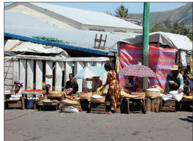
Mikaikaika ny mponin'i Faradofay sy ny manodidina, noho ny fiakaran'ny vidin-javatra.