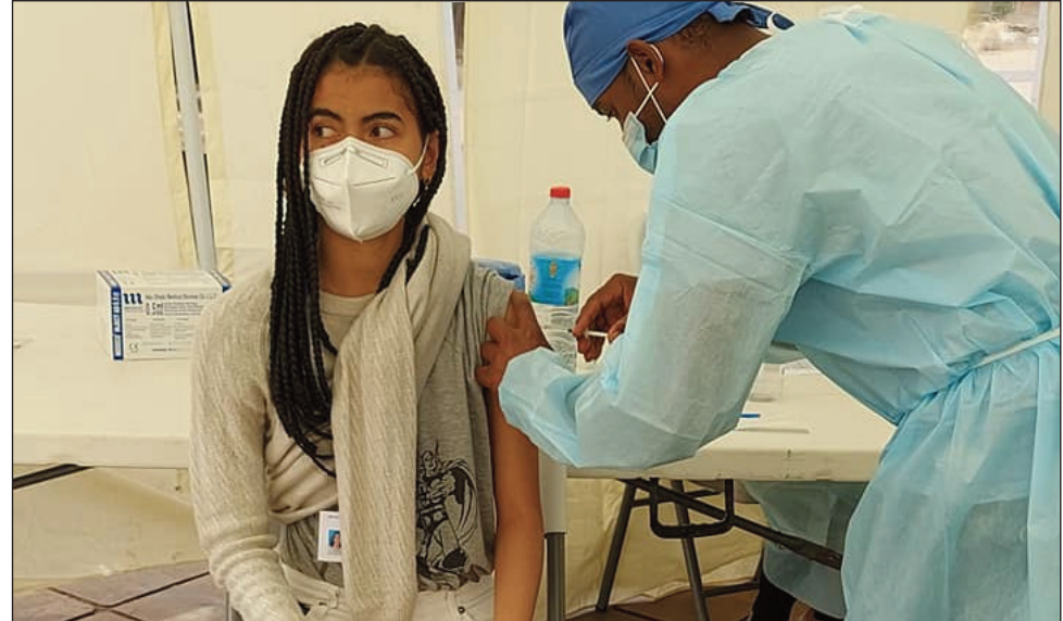
Maro ireo tonga nanao vaksinin'ny covid-19 tetsy amin'ny HJRA Ampefiloha.