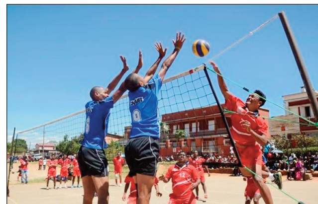
Lalao volley ball teny Itaosy.