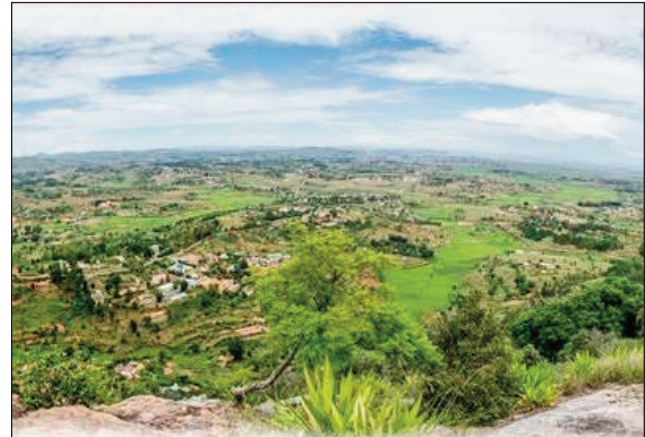
Ny tontolo manodidina eo anelanelan'Ambohidrabiby sy Ambohimanga.