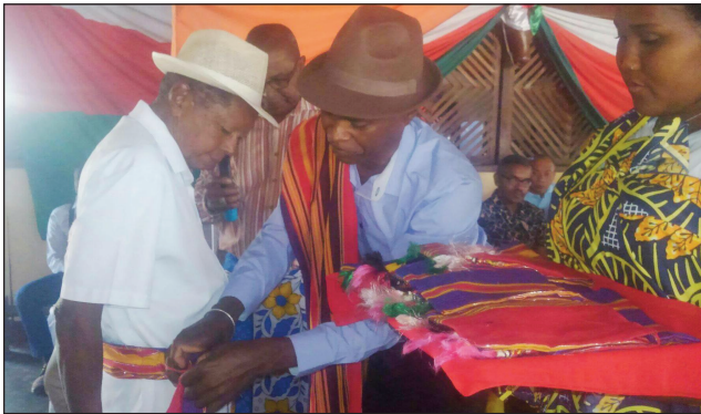
Ny lanonana ara-pom-ban-drazana notanterahana tany Ambanja.