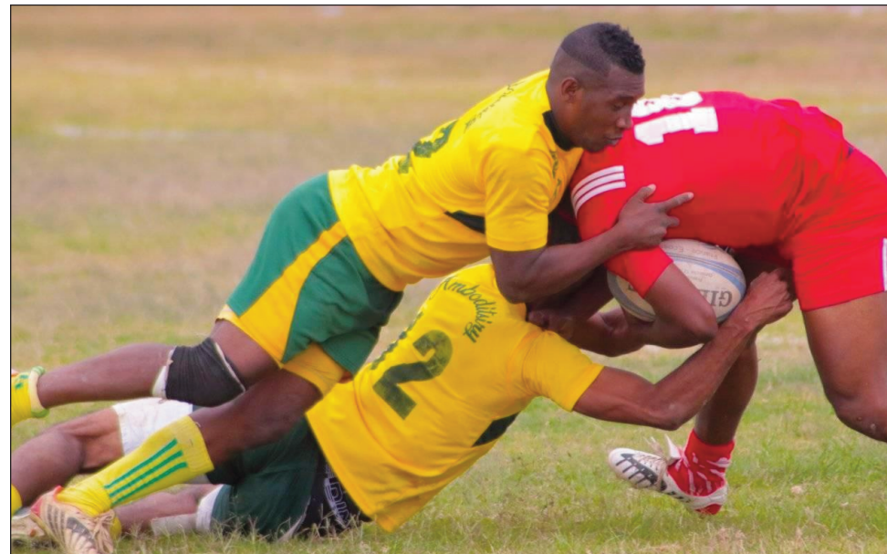
Rugby Doppel Top 20 teny Andohatapenaka.