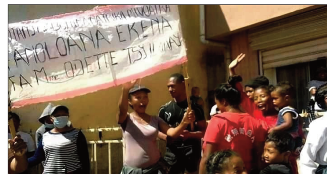
Ny hetsik'ireo mponina, tany Ambohimanatrika Tanjombato, Antananarivo Atsimondrano.