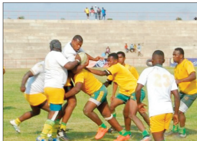
Rugby federaly 2 Malagasy.

Hitohy amin'ny faran'ny herinandro ho avy izao ny fifaninana rugby fiadiana ny ho tomponaka sokajy federaly 2, ka hahitana lalao eny amin'ny kianja Jiaspasika Ambohitsilaozana, sy any amin'ny kianja "Stade Stella Maris Toamasina", hiaraka amin'ny fifaninana fiadiana ny amboara "Coupe de l'indépendance" ho an'ny sokajy U20 any amin'ity farany ity. Fandaharam-dalao federaly 2 sabotsy 02 ôktôbra 2021, eny amin'ny kianja "Stade Makis Andohatapenaka : 09:00-Soe Stade # Uscar 2 Commune, 11:00-Vtma Antsahalovana # Ftam Mandrangobato, 13:00-XV Family Vondrona # Asa Ambohimanmarina, 15:00-Fbm Bemasoandro # Hiza 17 Angaranga-rana. Fandaharam-dalao