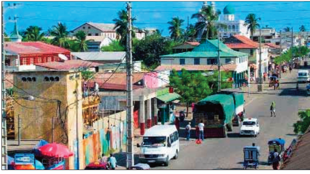
Ny tanànan'i Morondava, renivohitry ny faritra Menabe.

Hanao hetsika lehibe any Morondava faritra Menabe rahampitso zoma, ny vondron'ny mpanohitra RMDM: Rodoben'ny Mpanohitra ho an'ny Demokrasia eto Madagasikara, sy ny antoko TIM: Tiako i Madagasikara, izay ao anatin'ny RMDM ihany koa. Rahampitso zoma maraina, hanao fameloma-maso sy fanabeazamboho ny antoko TIM ny ao an-drdenivohitry ny faritra Menabe, ny tolakandro kosa, hanao fikaonandoham-paritra toy ny tany amin'ny faritra Vakinankaratra ny any an-toerana. Ny anton'ireo hetsika roa an'ny vondron'ny mpanohitra ireo dia satria misy zavatra mila toherina amin'