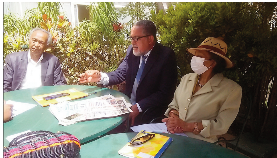
Ireo mpitarika ny VNNM.