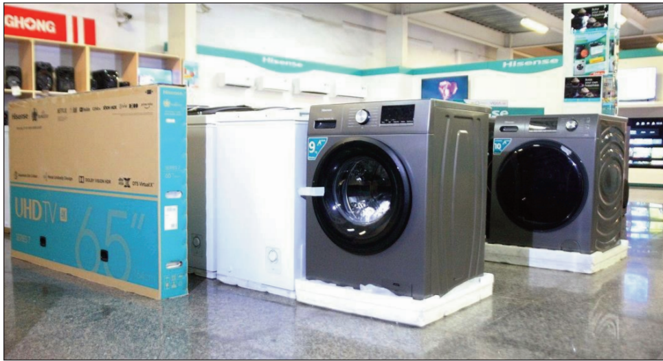
Entana avo lenta, hita amin'ny Tranombarotra Baolai.