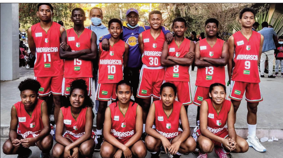
Ny Ankoay U15 lahy sy vavy 2021.

Nouvelle-Zelande, Venezuela ary Israel, eo amin'ny fifaninanana fiadiana ny ho tompondaka eran-tany amin'ny "SKILLS CHALLENGE U15 2021", ho tontosaina amin'ny 9 sy ny 10 Oktôbra 2021 ho avy izao. Mialohan'izany aloha dia hamarana ny fifaninanam-pirenena 2021 eo amin'ny taranja basikety ny FMBB Malagasy, ka hikarakara ny fifaninanana sokajy N1A lalao dingana faharoa sy ny lalao Famaranana, izay hizotra ao amin'ny Lapan'ny Kolontsaina sy ny Fanatanjahantena Mahamasina ny 02 ka hatramin'ny 10 Oktôbra 2021 ho avy izao.