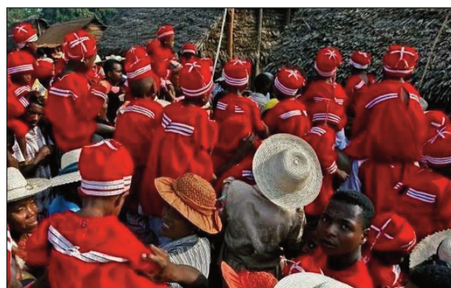
Sambatra any Mananjary.

Mandritra ny hanatanterahana ny hetsika Sambatra 2021, fanaovana famorana faobe ny zalahy Antambahoaka, any amin'ny tanànan'i Mananjary faritra Vatovavy dia hisy ny hetsika fifaninana ara-panatanjahantena "Sambatra Mananjary Milalao", hahitana fifaninana "Course lakana" sy "Course kankana" ary ny hazakazaka « Relais pedestre », ho karakarain'ny mpikarakara any an-toerana, miaraka amin'ny Ambasadin'i Frantsa miasa eto amintsika sy ny Ans ary ny La Maison du Sport à Madagascar amin'ny alakamisy 21