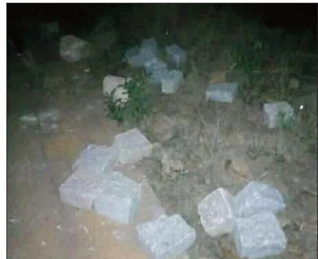
Vato nanakan'ireo jiolahy lalana tamin'ny RN7.