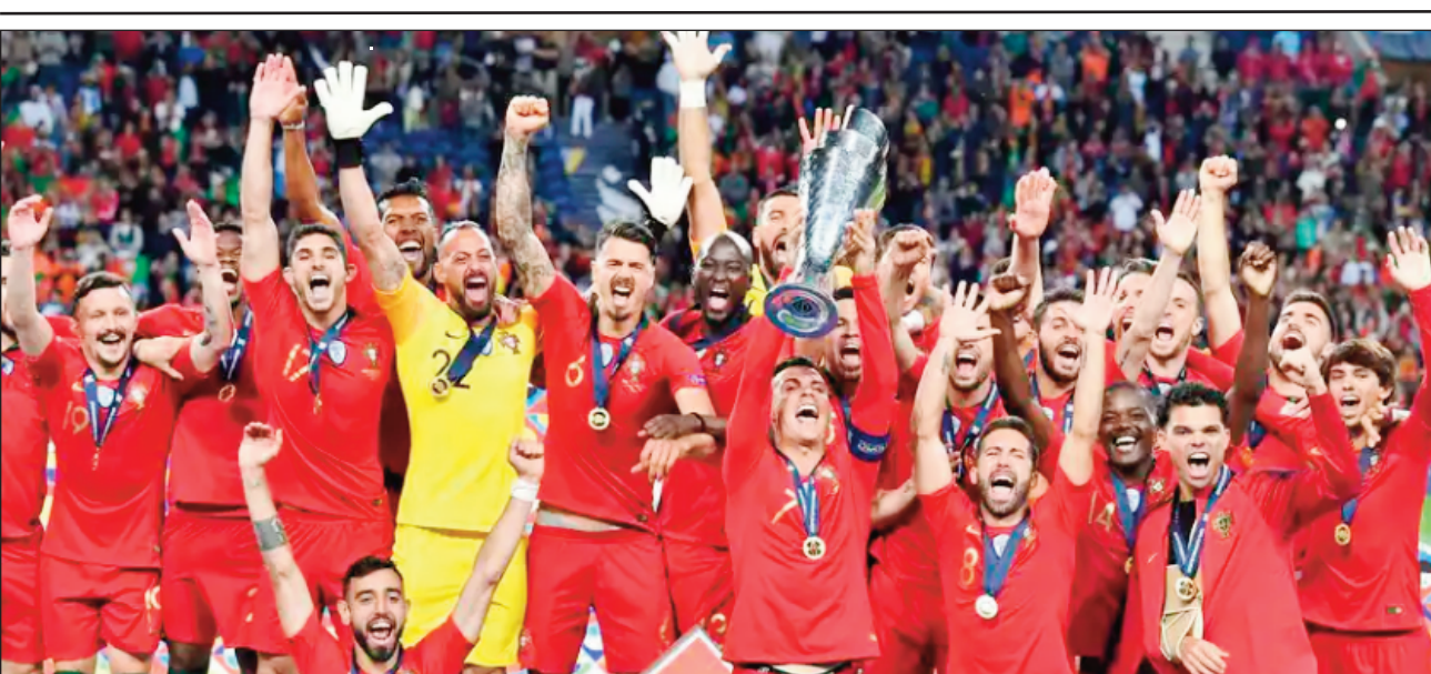
Portugal tompodaka farany.

Rahampitso alahady 10 ôktôbra 2021, ao amin'ny kianja « stade San Siro de Milan » any Italia, no hanatanteraha ny lalao famaranana ny fifaninanana baolina kitra « Ligue des nations de l'UEFA 2021 », hifanandrian'ny « Trico-