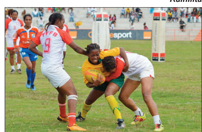
Rugby vehivavy Malagasy.