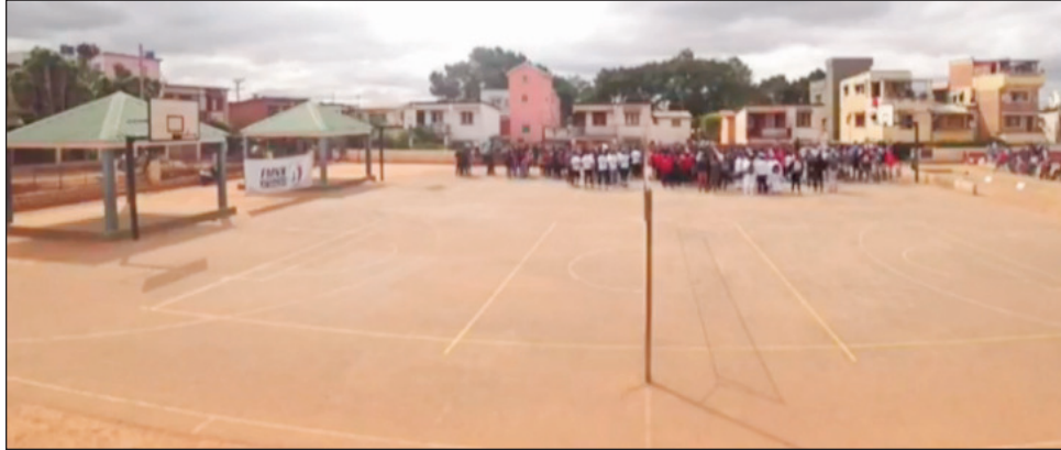
Kianja fanaovana volley eny Itaosy.

Hanomboka anio sabotsy 30 ôktôbra amin'ny alalan'ny fanatontosana ny dinika teknika eny amin'ny kianja « Akany Sambatra » Itaosy, ny fifaninana volley-ball fiadiana ny ho tompondakan'i Madagasikara 2021 sokajy "Elites U 23" ary rahampitso alahady 31 ôktôbra kosa, no tena hanombohan'ny fifanintanana hatramin'ny alatsinainy 01 nôvambra 2021. Hifindra eny amin'ny kianja mitafofon'Ankorondrano amin'ny fanatanterahana ny dingana famaranana ny hetsika hanomboka amin'ny talata 02 nôvambra, ka tsy hifarana izany