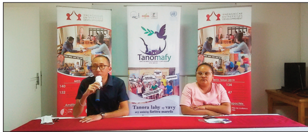
Ireo anisan'ny mpikarakara ny hetsika Ketsika sy Kandra.