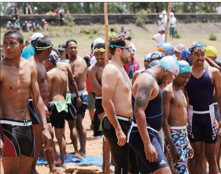
Mpifaninana triathlon eto Madagasikara.

Haresaka tanteraka ny tanànan'i Toamasina sy Mahajanga hanomboka anio sabotsy 30 oktobra 2021, amin'ny fandraisana ny hetsika ara-panatanjahantena aquathlon sy triathlon ary "championnat national Asief", izay samy ho sokofana amin'ny fomba ôfisialy anio avokoa ny fanatanterahana azy. Any Toamasina dia ny fifaninana aquathlon no hatomboka anio, fa rahampitso alahady kosa no hanatontosana ny fifaninana triathlon. Anio sabotsy ihany koa no hosokafana ôfisialy ny fifaninana ara-panatanjahantena ho an'ny mpiasam-panjakana, ka manodidina ny 12000 isa izy ireo, no efa any Mahajanga ankehitriny. Raha ny marina dia hiarahan'ny fanatanjahantena sy fizahantany avokoa ireo hetsika roa ireo.