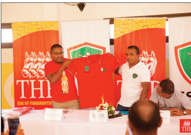
Fanoloran'ny THB fitaovana teny Antanimena.

Efa an-taonany maro no nanara-dia ny taranja tsipy kanetibe ny THB ary manamafy indray izany fiaraha-miasa izany, amin'ny fanohanana ny « Fédération Sport Boules Malagasy » (FSBM), sy ny ekipa nasionaly malagasy amin'ireo fifaninanana iraisam-pirenena hatrehiny. Notontosaina tamin'ny alakamisy teo, tetsy Antanimena, ny fanolorana tamin'ny fomba ôfisialy an'ireo ekipam-pirenena malagasy 4 tonta sy ny ho fandehan'ny lalao any ampitan-dranomasina any, izay hatrehin'ny Filohan'ny FSBM, ny mpisolotenan'ireo mpanazatra, mpilalao vitsivitsy ary ny solontenan'ny THB mpiara-miombon'antoka amin'ny Fsbm. Maro mpankafy sy mpilalao ny taranja tsipy kanetibe eto Madagasikara ary anisan'ny lalao hiavahan'ny Malagasy eo amin'ny se-