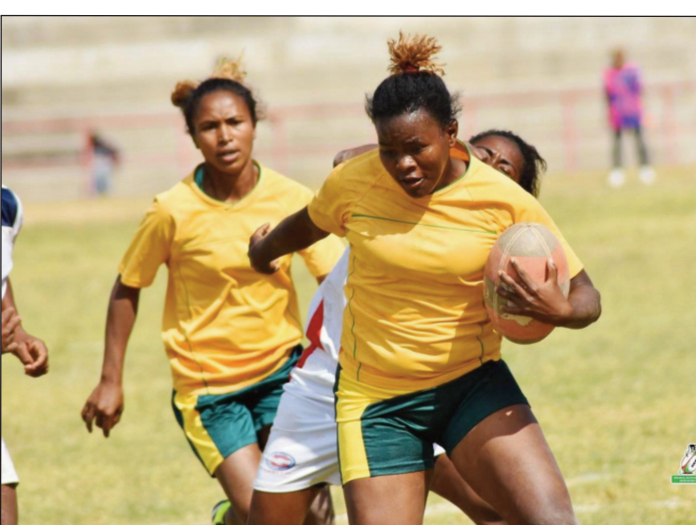
Mpanao rugby vehivavy.

Raha efa fantatra avokoa ireo ekipana rugby sokajy federaly 1 lehilahy miisa 16, handray anjara amin'ny fifaninanana Doppel Top 20- 2021, izay handrasana amin'ny 7 novambra 2021 ho avy izao ny andro voalohany amin'izany 1/8-ndalana izany, ka ahitana ny 3Fai Vakinankaratra, Ftm Manjakaray, Tam Anosibe, Ftba Andohatapenaka, Cosfa Miaramila, Mang'Art Manjakaray, Stm Savonnerie, Tfa Anatihazo, Uskar Commune, Tfma Ankasina, 3Fb Fahasalamana, Usa Ankadifotsy, Scb Besarety, Us Ikopa, XV Fa Ampasika ary ny Jsta Ambondrona dia fifaninanana ho an'ny andriambavanitra kosa, no harahina eny amin'ny kianja Makis Andohatapenaka anio sabotsy 30 ôktôbra 2021. Fandaharan-dalao ho hita amin'izany : D-2 vehivavy 09:30-Fanja Anjanahary # Tam Anosibe. 11:00-Sabnam Sabotsy # Asut Ankatso D-1 vehivavy. 13:30-Ftm Manjakaray # FtvL Lalamaty. 15:00-Scb Besarety # 3Fb Fahasalamana.