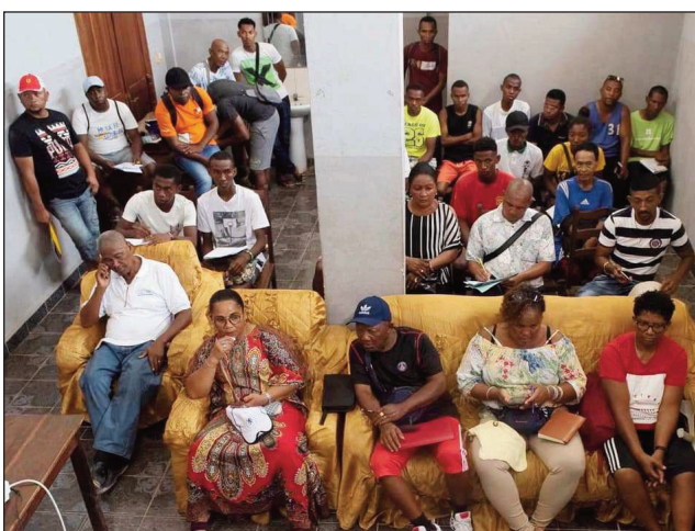
Dinika teknika Handball tany Mahajanga.

Tontosaina any Mahajanga nanomboka tamin'ny 28 oktobra 2021 lasa teo, ka tsy hifarana raha tsy amin'ny 07 novambra 2021 izao ny fiadiana ny ho tompondakan'i Madagasikara 2021 taranja Handball sokajy senior lahy sy vavy. Vita tamin'ny alakamisy 28 oktobra teo ny « Réunion technique » sy ny « tirages au sort des poules » tamin'izany, raha tamin'ny zoma 29 ôktôbra 2021 kosa no tena nanombohan'ny fifaninanana. Fantatra fa toy izao ny firafitr'ireo vondrona misy an'ireo ekipa mpan-drainy anjara tsirairay avy : Sokajy vehivavy Poule A :