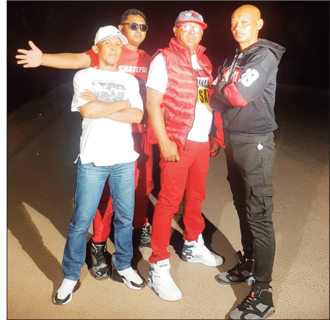
Ny Gasta, mbola vonona hatrany hanandratra ny Rap.