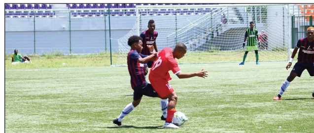
« Poule des As 2021 » tany Toamasina.