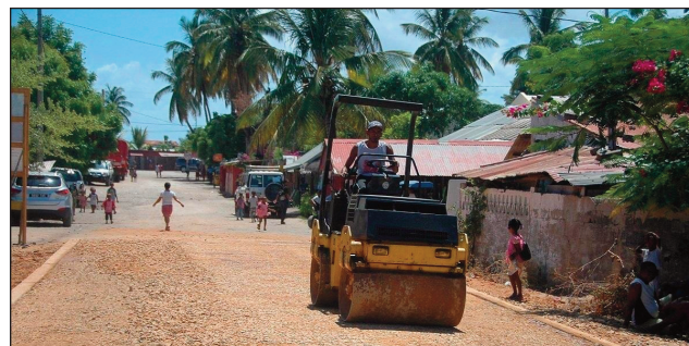
Eto Morondava ihany no voalaza fa misy ny asa ataon'ny governoran'ny.