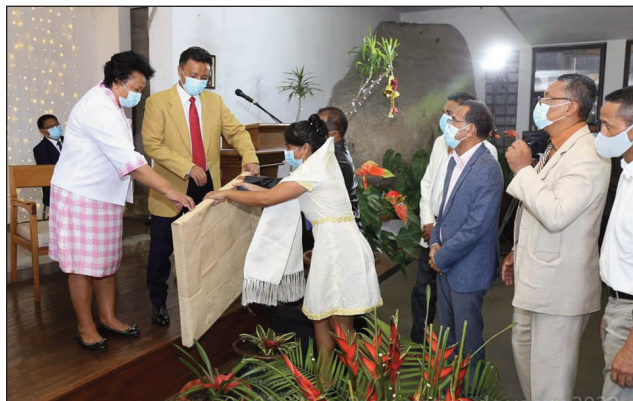
Ny fifampiarahabana nahatratra ny taona vaovao teny Faravohitra ny sabotsy teo.

Nifampiarahaba tamin'ny birao politikan'ny anto Tiako i Madagasikara (TIM), sy ireo mpiaramiasa aminy akaiky, ny filoha Marc Ravalomanana mivady, teny Faravohitra ny sabotsy voalohan'ny volana janoary, fankalazana ny taom-baovao teo. Tamin'izany no nanamafisan'ny filoha nasionalin'ny antoko TIM, sady filohan'ny RMDM Marc Ravalomanana, fa vonona hanavotra ny firenena sy ny vahoaka Malagasy izy, amin'izao firenena latsaka an-katerena izao, noho ny tsy fahaiza-manaon'ny fitondrana tarihan'ny filoha Rajoelina. Tao aorian'ny 2021, taonan'ny fahasahiana, hoy i Dada, ho taonan'ny fijoroana ity taona 2022 ity. Tokony hisy ny fikaonandoham-pirenena hoy izy hanitsiana ny firafitry ny CENI, na ny Vaomierampirenena misahana ny fifidianana sy HCC, na ny Fitsarana Avo momba ny Lalampianarenana amin'izao fotoana. Efa nilaza ny filoha lefitry ny CENI teo aloha, fa nisy ny "doublon" an-tapitrisany tamin'ny fifidianana tamin'ny taona 2018, ny filohan'ny CENI vaovao ankehitriny anefa hoy izy nilaza fa tsy nisy an'izany. Midika izany hoy ny filoha Ravalomanana, fa efa hitanila sahady ity rafitra mpikarakara fifidianana eto amintsika amin'izao fotoana izao ity. Teo am-pamaranana, nirary soa ny vahoaka Malagasy tsy ankanavaka izy noho izao Asaramanitra izao: " faly aho tena faly tokoa ary