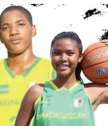
Basket U18 lahy sy vavy.

Hanomboka anio any Betsiboka ny fifaninanana basikety « Championnats Nationaux U 18 Filles et Garçons ». Omaly zoma 10 Jona 2022, tao amin'ny "Restaurant Le Mandarin Maevatanana" no nanatanterahana ny "Réunion technique" ho an'ity fifaninanana ity, izay notarihan'ireo teknisian'ny FMBB « Fédération Malagasy de Basketball ». Niaraka tamin-dry zareo ao amin'ny "Ligue Régionale de Basketball Betsiboka". Efa vonona tanteraka ary efa voatsiriky ny FMBB ireo kianja roa hanatanterahana ny hetsika dia ao amin'ny CAPJ-Maevatanana, sy ao amin'ny LRBB Betsiboka, ka anio sabotsy 11 ka hatramin'ny 19 jona 2022