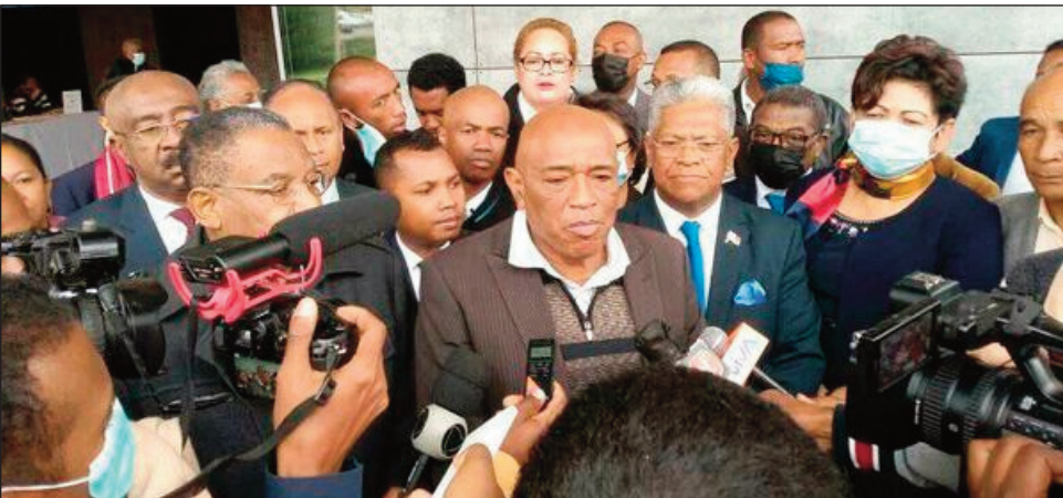
Ny RMDM sy ny Vondrona Panorama teny amin'ny CENI Alarobia ny alakamisy teo.

Vaomieram-pirenena Mahaleotena misahana ny