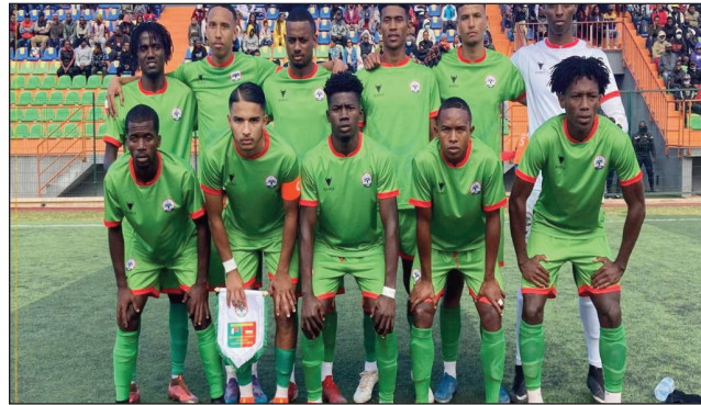
Barea U23, 2022.

Ho fanomanana ny fifaninantsanana "CAN 2023" sy ny "Jeux Olympiques 2024" dia nandresy ny Club M U23, 2 - 1 ny Barea U23 tamin'ny lalao ara-pirahalahina "Derby de l'Océan Indien" nokarakarain'ny UFICASM & Madas niaraka tamin'ny FMF "Fédération Malagasy ny Baolina Kitra", tetsy amin'ny kianja "Elgeco Plus Stadium By Pass" tamin'ny alakamisy 09 jona 2022.