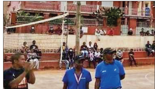
Lalao volley-ball eto Analamanga.