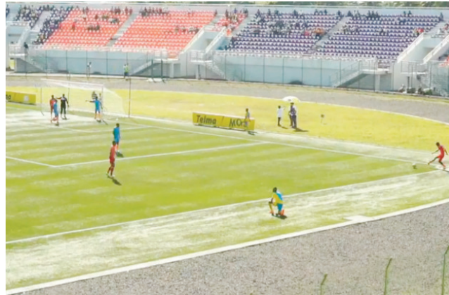
Nandritra ny lalao Telma Coupe de Madagascar.

Tany Ambanja : Casa Nosy Be (Diana) 2 - 1 Kfca (Diana), tany Ambovombe : As Jm (Androy) # As Comato (Atsimo Andrefana) haverina amin'ny andro manaraka, tany Ambatomainty : Voromaherin'Alaotra (Alaotra Mangoro) 0 - 1 As St Pierre (Alaotra Mangoro), teto Antananarivo : Cospn (Analamanga) 6 - 1 As Anry (Bongolava), As St (Analamanga) 6 - 1 Zan-