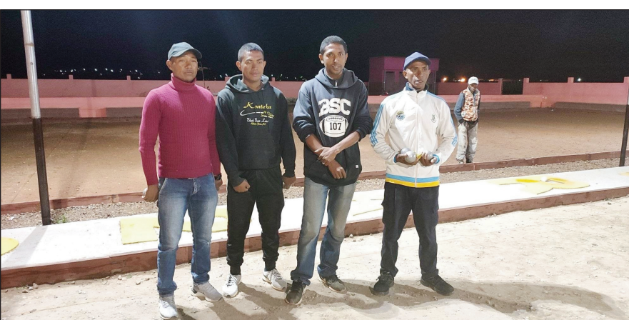
Tsipy kanetibe Asief.

Tontosa tamin'ny sabotsy 04 jona 2022 lasa teo, teny amin'ny Bouloirdrôme Fitaratra eny Tongarivo Tanjombato, ny fifaninanana tsipy kanetibe fiadiana ny ho tompondakan'ny Asief Analamanga 2022 eo amin'ny "Doublette open". Voahosotra ho tompondaka tamin'izany i Mparany sy Raoul (UA), izay nandresy ny ekipan'ny (Minjus) teo amin'ny lalao famaranana. Tsihivina kosa, fa eo amin'ny « 1ere demi finale » : MINJUS nandresy ny JIRAMA, teo amin'ny « 2eme demi finale » : UA nanilika ny MPTDN/Tresors.