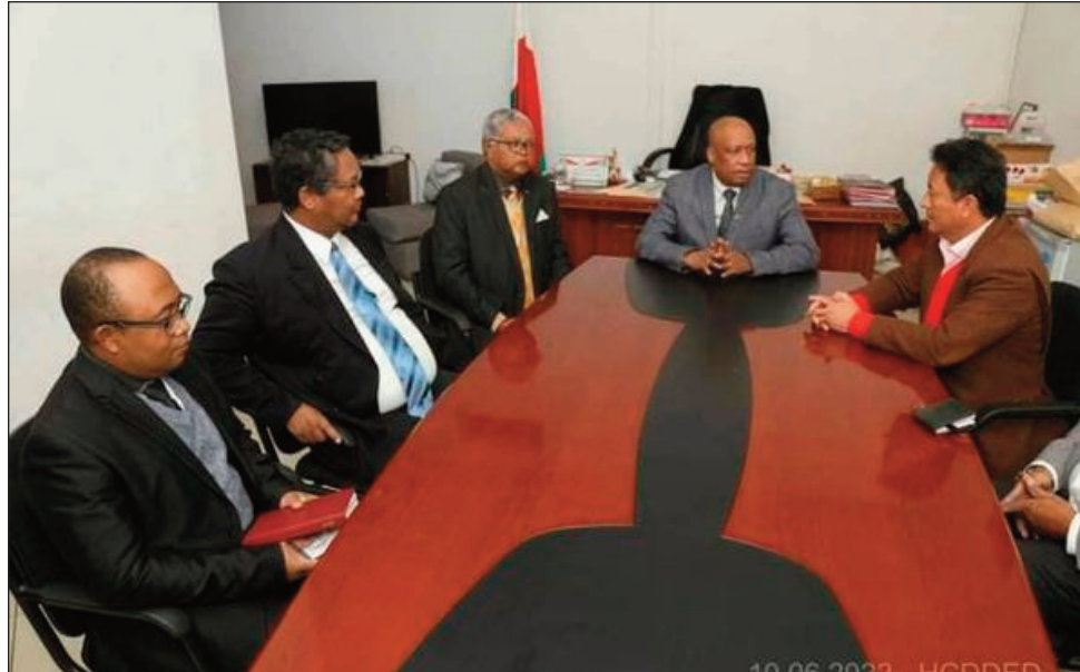
Ny avy amin'ny RMDM sy ny Vondrona Panorama, teny amin'ny CENI ny alakamisy teo, mitsipaka ny fikaonandoham-pirenena sadasada ataon'ny CENI.