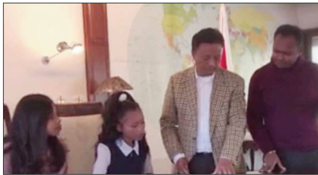
Ny filoha Ravalomanana, nihaona tamin'ny ACIM teny Faravohitra.

valomanana ary nahita fa mety ny fomba fitondrany, indrindra mahakasika ny sehatry ny fambolena sy fiompiana. Manana tetikasa ny ACIM, ka nentiny nanoloana ny filoha Ravalomanana izany, satria hitan izy ireo fa tsy ny rehetra no manana traikefa, hitan'izy ireo ny fandrosoan'ny firenena tamin'ny fotoana nitondrany sy ny faminganana : fanapotehana natao teto ka nahatonga fahaverezan'asa maro tamin'ny taona 2009 ireny. Efa tafakatra ny firenena nefa nosintonina nidina indray, hoy ny ACIM. Ilaina ny manana vina sy tanjona hoy ny Filoha Marc Ravalomanana, tsy mety ny mitady vola fotsiny, nefa tsy fantatra sy tsy hay izay ampiasana azy.