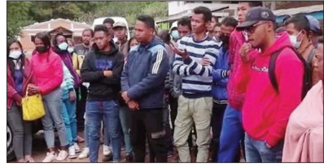
Ny fitokonan'ireo mpiasan'ny Office dy Bacc.