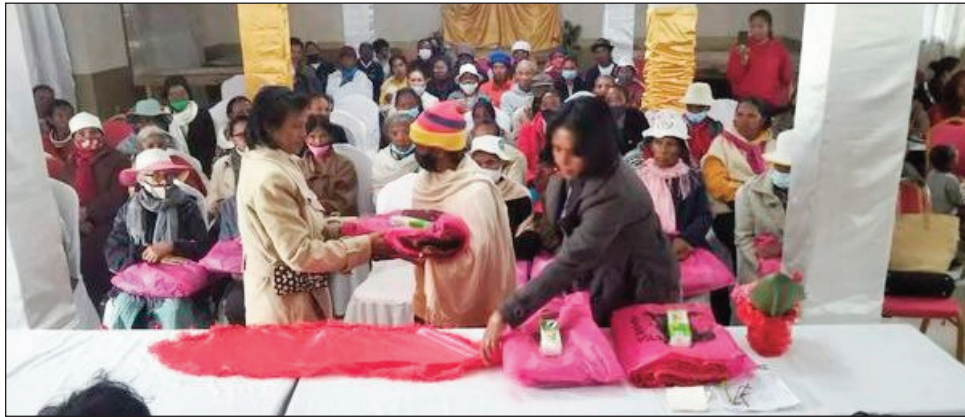
Fanolorana bodofotsy sy savony ho an'ireo zokiolona sahirana.

Nisy ny varotra fampirantiana nokarakaraina tamin'ny fetin'ny Reny tao amin'ny Magro Behoririka, ny faha 27 sy 28 mey 2022 lasa teo. Araka ny fanapahan-kevitra noraisin'ny mpikarakara dia ny vola azo rehetra nandritra izany dia natokana manontolo nividianana bodofotsy sy savony ho an'ireo reny Zokiolona sahirana tsy mba mandray ny fisotroandronono eny amin'ny CNAPS. Hita mantsy fa tena sahirana izy ireo, ka izany no nahatonga ny fanapahan-kevitra, ny andro mangatsiaka, ny savony miakatra izay tsy izy ny vidiny ankehitriny. Nokendrena ihany koa mba ny vokatry Malagasy no nosafidiana, hanandra-