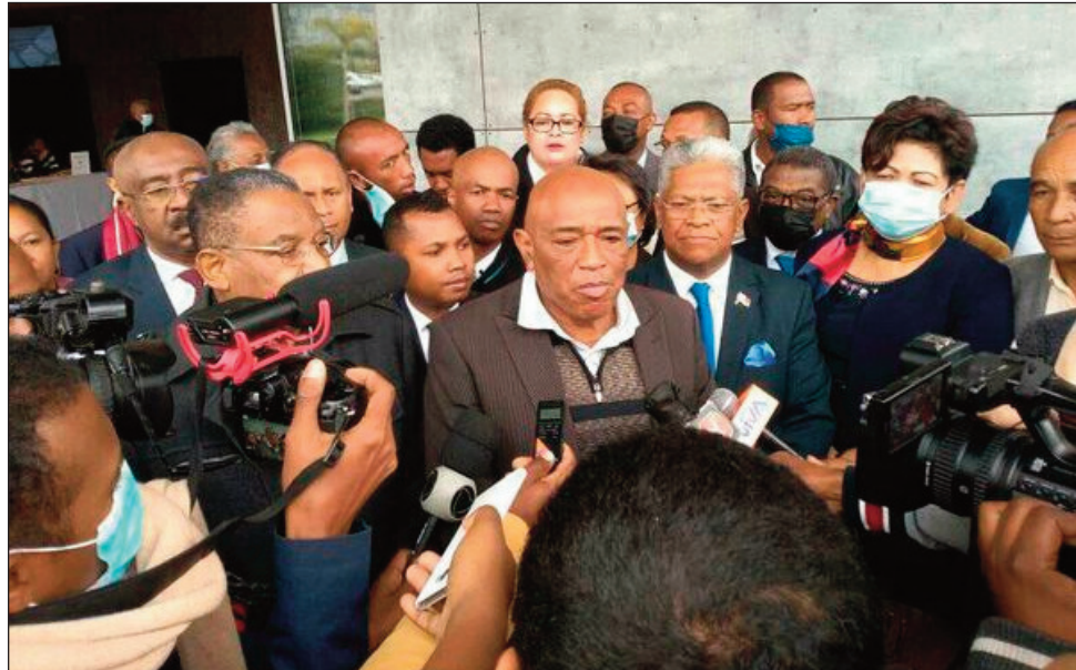
Ny filoha Marc Ravalomanana, nihaona tamin'ireo avy amin'ny HCDDDED, tetsy Soanierana omaly.