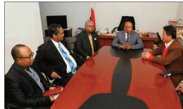
Ny filoha Ravalomanana, nihaona tamin'ny HCDDDED teny Soanierana omaly.