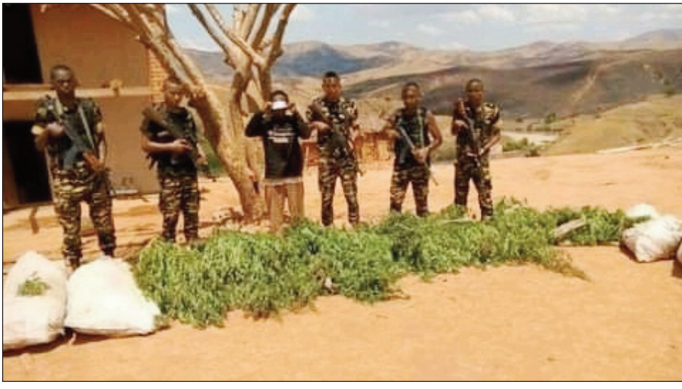
Ireo rongony sarona tany Ankazobe.

Rongony 200 fototra milanja 130 kg no saron'ny zandary tany Ankazobe faritra Analamanga. Ny sabotsy teo, nisy olona tsara sitrapo nampandre ny vondron-tobim-paritry ny zandarimaria Ankazobe mahakasika ny fisian'ny toerana iray fambolena rongony ao Ambatolosoatra, fokontany Tsinjorano, kaominina Tsaramasoandro, distrikan'Ankazobe. Tsy niandry ela fa ny alahady tamin'ny dimy ora maraina dia nidina tany amin'ny toerana voalaza ireo zandary, izay efa manao ny asa fampandrian-tany ao amin'ny kaominina Tsaramasoandro. Vokany: rongony 200 fototra, milanja 130 kilao nambolena teo amin'ny