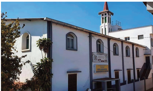
Ny FJKM Ivato Seranana.

Fotoan-dehibe ho an'ny fiangonana eny amin'ny FJKM Ivato Seranana, distrikan'Ambohidratrimo ny alahady 30 oktobra 2022 ho avy izao. Hankalazaina eny an-toerana ny fetin'ny taranaka 2022 sy famaranana ny jobily faha-150 taona ny Fiangonana, ka hanomboka amin'ny 8 ora maraina izay fidirana tokana ihany no hisy amin'io fotoana io. Hasaina ho tonga eny an-toerana ny zanaky ny fiangonana rehetra, na ny eo an-toerana na ny zanaka ampielezana manerana an'i Madagasikara,