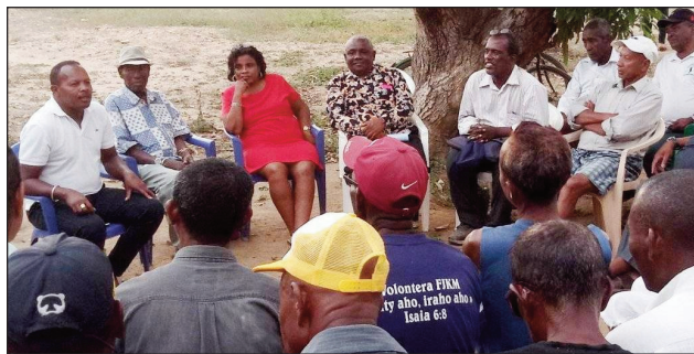
Ny fikaonana'ireo mpitarika ny RMDM, tany amin'ny renivohitry ny faritra Atsimo Andrefana.