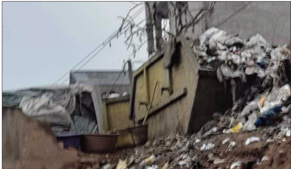
Potika tsy vitan'i Vazahabe sy ny ekipany ny lalana etsy amin'ny Cotona Tsaralalana, efa tonga anefa ity ny fotoanan'ny orana.