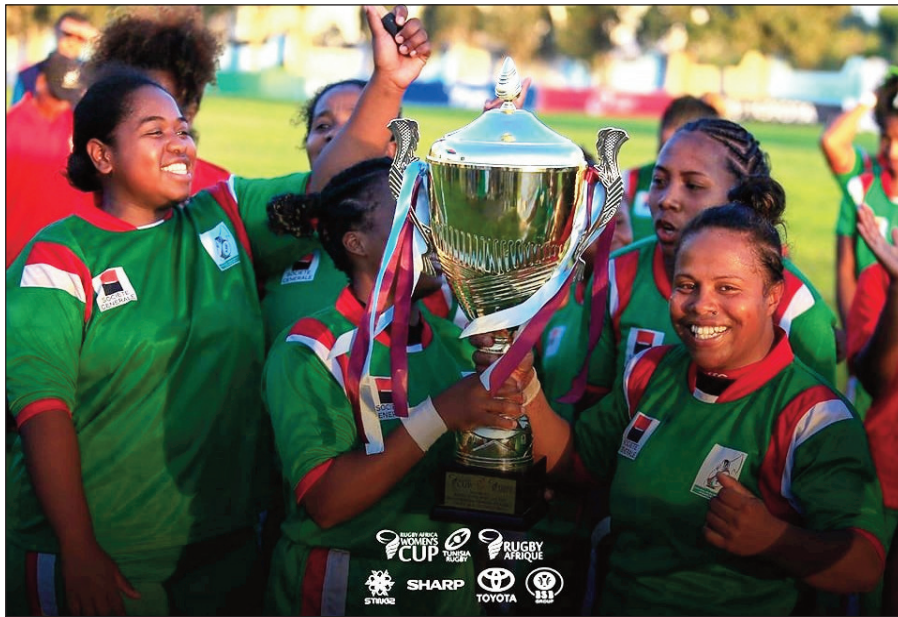
Ny XV Makis Ladies nandray ny amboara.

Natao ny 14 hatramin'ny 22 oktobra 2022 lasa teo tany Tunisie ny «Rugby Africa Women's Cup», izay mivondrona ao amin'ny vondrona C nahitana an'i Madagascar sy Sénégal ary Tunisie. Nandresy tamin'ny isa 34 noho 25 ny XV Makis Ladies nandritra ny lalao voalohany nihaonana tamin'ny ekipan'i Sénégal. Nibata fandresena hatrany ny XV Makis Ladies tamin'ny lalao faharoa izay nihaonana tamin'i Tunisie, raha nisaraka tamin'isa 27 noho 05. Mitana ny laharana voalohany ao anatin'ny vondrona C i Madagasikara ary nahazo ny tapakila hiatrehana ny fifanintsananana ny fiadiana ny amboara maneran-tany amin'ny taona 2023.