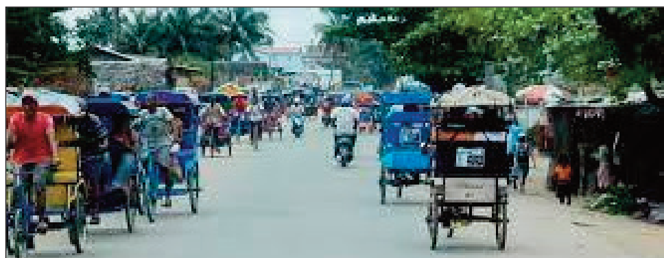
Misy faritra tsy mandry fahalemana i Toamasina.

Tsy milamina mihitsy amin'izao fotoana ny ao amin'ny Tanambao Verrerie Toamasina any amin'ny faritra Atsinanana. Tao aorian'ilay fanafihana ka nahafatesana raim-pianakaviany iray ny faran'ny herinandro teo, nisehoana asan-jiolahy indray omaly vao mangiran-dratsy tao amin'ity fokontany ity. Araka ny fampitam-baovao nohamarinina avy any an-toerana, ao Tanambao-Verrerie parcellé 21/74. Omaly tamin'ny 1 ora sy sasany maraina no nisy trangana fanafihana indray, telo lahy nisarontava no nidi-