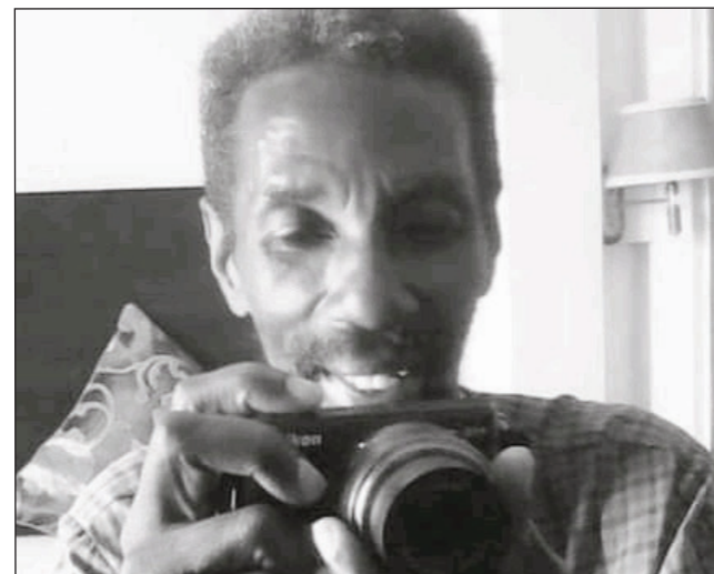
Ny mpanao gazety Faly, na Ra-Faly fahavelony.