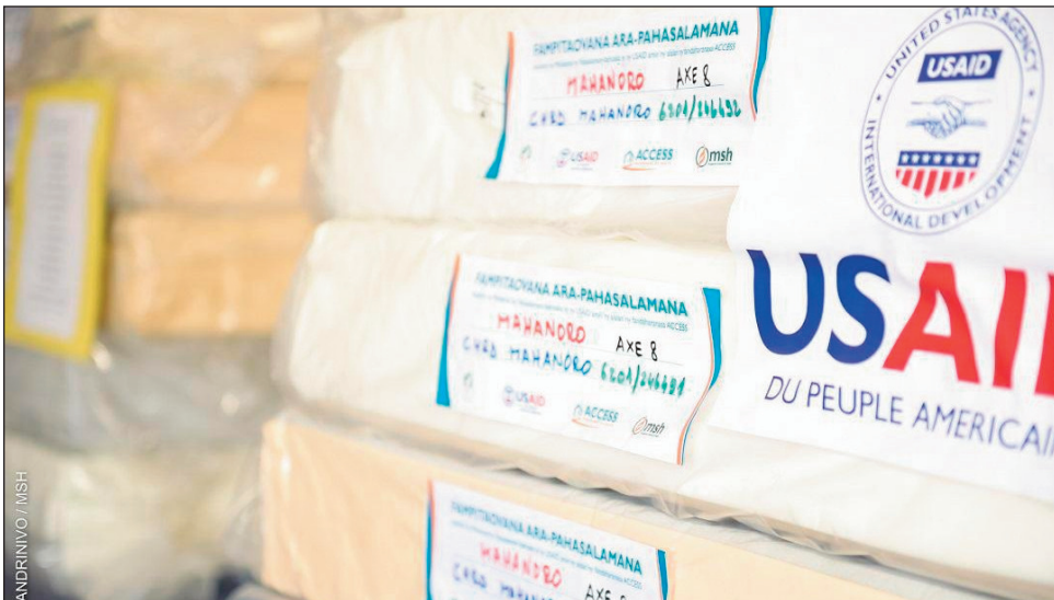
Fitaovana ara-pahasalamana samihafa avy amin'ny Amerikana.