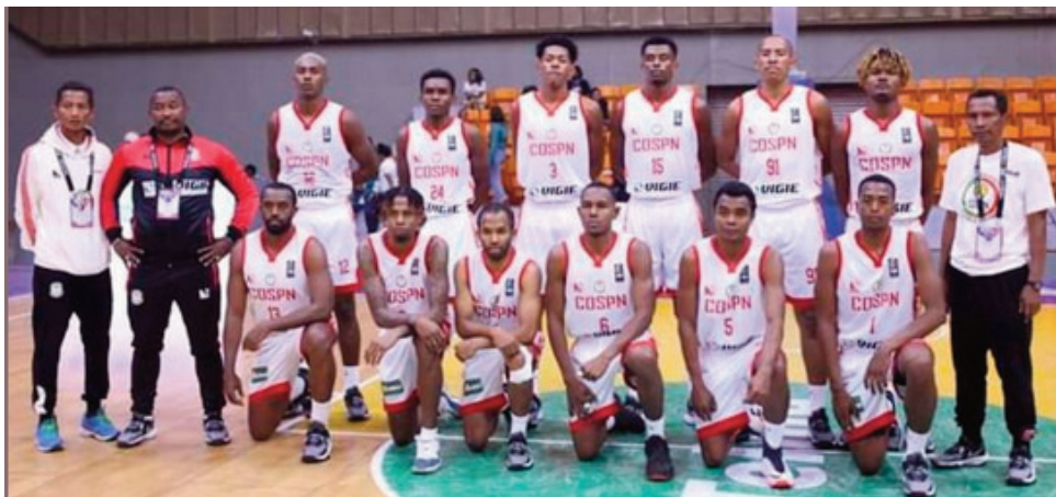
Ny Cospn Madagascar.

Ny Cospn Madagascar sy ny Kpa Kenya no tafita any amin'ny dingan'ny "Élite 16", amin'ny fifaninana Road To Bal 2022 tao anatin'ny vondrona Madagascar nahitana ekipa 3 nifaninana. Ny Cospn no nitana ny laharana voalohany ary ny Kpa Kenya no nitana ny laharana faha-2. Tamin'ny lalao voalohany notontosaina tetsy amin'ny "Palais des Sports Mahamasina" tamin'ny zoma 21 ôktôbra 2022 lasa teo, ny Cospn Madagascar dia nandresy ny ekipan'ny Djabal Comores tamin'ny isa 110-58. Tamin'ny andro faharoa, sabotsy