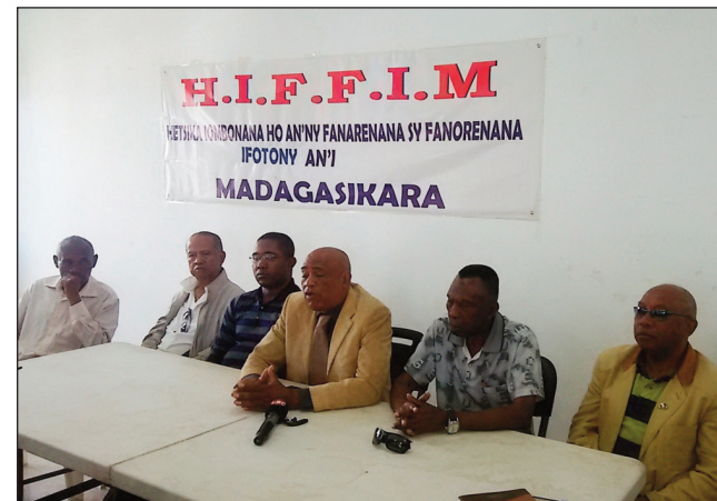
Ny avy amin'ny HIFFIM.