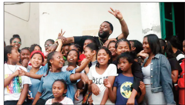
Mpanakanto Frantsay Tayc nandalo teny Faravohitra.