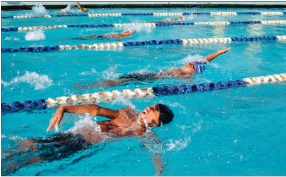
Lomano Vive l’Avenir.