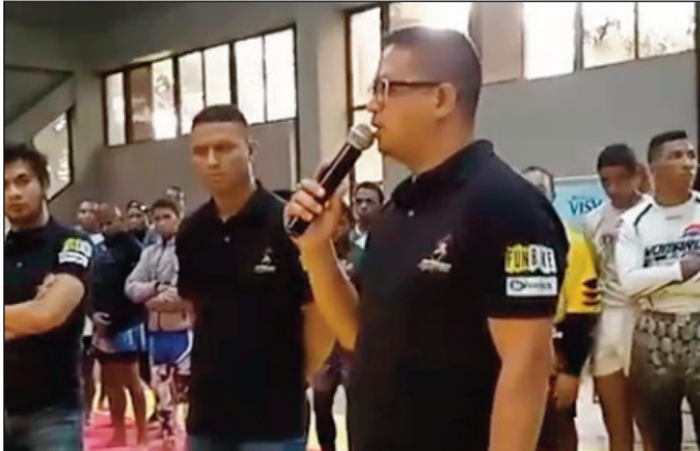
Mpikarakara ny Nach No-gi teny Mahamasina.