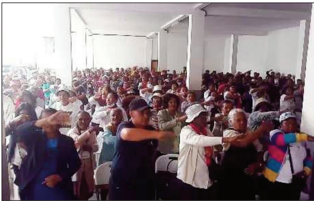
Hetsiky ny Vehivavy TIM Analamanga tetsy Bel’Air.

Nisy ny sakana natao tamin’ny vehivavy TIM Analamanga ny alarobia 8 martsa, andron’ny vehivavy maneran-tany. Tsy tontosa araka ny tokony ho izy ny fandaharam-potoana izay noeritreretin’ny mpikarakara tamin’izany, satria ny fotoam-bavaka izay zavadehibe tamin’ny vehivavy TIM Analamanga aza dia teo amin’ny arabe no notontosaina tamin’izany. Manoloana izany indrindra dia nisy ny fihonana nataon’izy ireo tao amin’ny foiben-toeran’ny antoko TIM, tao Bel’Air Ampandran’ny sabotsy lasa teo, niarahana’ny rehetra nanohy ny fandaharam-potoana izay efa noeritreretina tamin’ny 8 martsa andron’ny vehi-