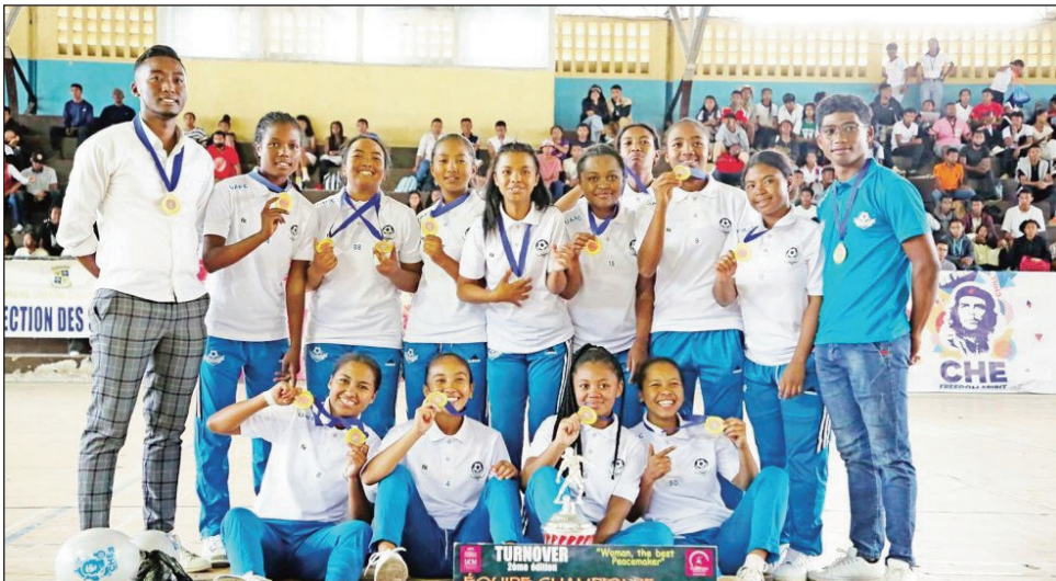
Ny ekipan'ny Aceem vehivavy 2023.