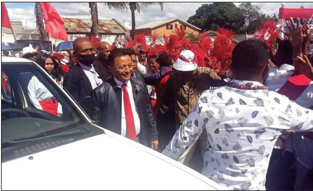
Ny filoha Marc Ravalomanana tao amin’ny SK Melody Mandriambero.

-Koa manentana anareo rehetra izay mbola tsy ao anaty lisi-pifidianana, mba hanatona ny Fokontany misy anareo tsirairay avy hanoratra anarana, hanamarina ihany koa raha efa ao ny anaranareo na tsia, satria zo fototra maha olom-pirenena vanona sy vonona ny