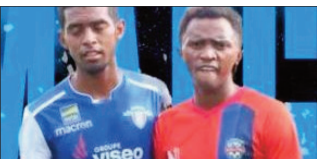
Orange Pro-League 2022-2023.

Tsy tontosa noho ny resaka kianja ny lalao baolina kitra, “Orange Pro-League 2022-2023” andro faha-9, tokony ho natao tao amin’ny kianja Maître Kira Andaboly tamin’ny faran’ny herinandro teo. Ireo lalao hafa rehetra kosa dia nizotra tamin’ny antsakany sy andavany avokoa. Voka-dalao « Conférence Nord » : -As