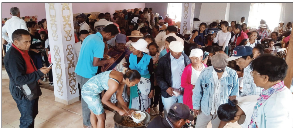
Ny Asaramaniry ny taom-baovao, ho an'ny antoko TIM, tao Ambavahaditokana Antananarivo Atsimondrano.

Nahatratra 200 mahery ireo mpikatroka Tiako i Madagasikara (TIM ® ), ao amin'ny Kaomina Ambavahaditokana distrikan' Antananarivo Atsimondrano, nifampiarahaba noho ny taom-baovao ny sabotsy teo. Izy ireo ihany no niara-nizaka ny fandanianana rehetra, tamin'ny nofon-kena mitam-pihavanana nokarakarainy. Ny tsipaipaika teo am-pisoratana anarana, no niampy tolo-tanana avy amin'ny mpikambana vitsivitsy no natambatra tamin'izany, nahafahana niara nifety sy nifaly. Ny fihaonana dia nahafahana nifanentana amin'ny andraikitra tokony ho raisin'ny rehetra, ma-