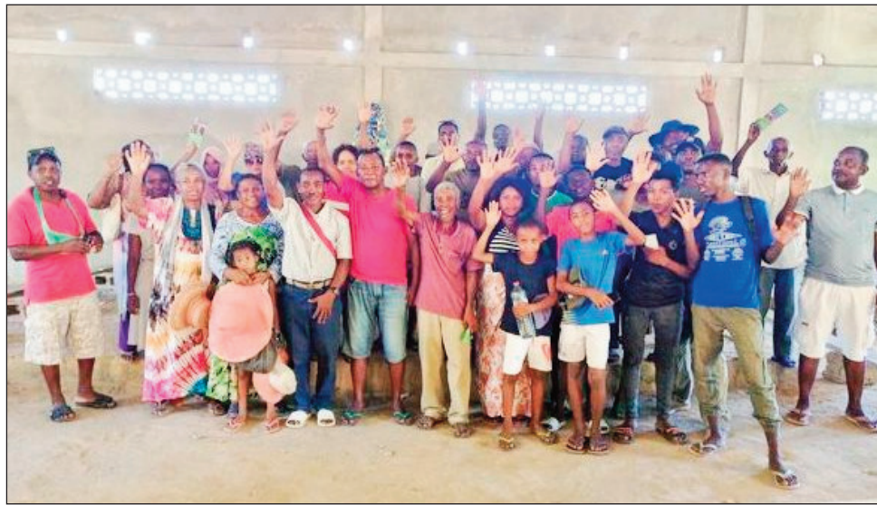
Rehefa tsy tontosa ny 8 martsa teo tao amin'ny Magro Behoririka, noho ny fanakanan'ny mpitandro filaminana ny fankalazana ny fetin'ny vehivavy ho an'ny Vehivavy TIM Analamanga. Notanterahana ny sabotsy teo izany tao Bel'Air, nanaovana famelabelarana narahina ady hevitra, sy nizarana ny nofon-kena mitam-pihavanana ho an'ireo mpikatroka tonga maro tokoa.