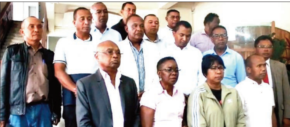
Ireo depiote sasany teny Tsimbazaza ny alakamisy teo.

ny asa sahanin'ny Governemanta dia ny fanontaniana am-bava, fanontaniana an-tsoratra, ny fanadinana hentitra, ny fampiasana ny Vaomiera mpanao famotorana ary ny fihainoana amin'ny alàlan'ny Vaomiera. » Tsy nanohina ny antso ireo minisitry voakasika tamin'izany araka ny nambaran'ny Filohan'ny Vaomiera dia ny minisitry ny fiarovam-pirenena, ny filaminam-bahoaka, ny fitsarana, ny ati-tany ary ny sekreteram-panjakana misahana ny zandarimariam-pirenena no resaka, noho ny tsy fahatongavan'ireo ministra ireo teny Tsimbazaza, tompon-trano mihono ny vahoaka. Nangonin'i Stefa