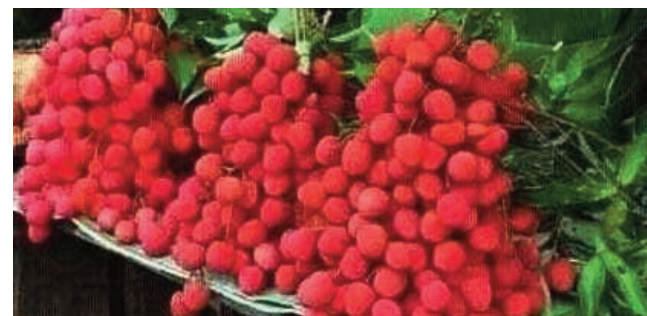
Letchi, anisan'ny vokatry eto amintsika amin'ny volana novambra toy izao.