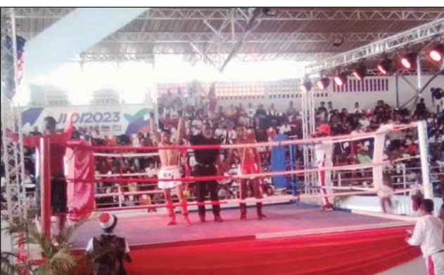
Kick boxing teny Mahamasina tamin'ny alahady.

Notolorana amboara tafavoaka ho mpandresy, avokoa ireo mpikatroka tamin'ny fifaninanana kick