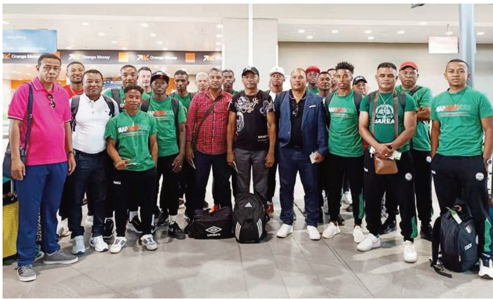
Ny delegasiona Malagasy nanainga teny Ivato.

Efa any Accra Ghana hatramin'ny omaly alatsinainy 13 novambra 2023 ireo mpilalao Barea de Madagascar avy eto an-toerananana nanainga teny Ivato tamin'ny alahady 12 novambra teo. Niditra tao anaty fiaramanidina nitondra azy ireo tao Addis Abeba i El Hadary milalao any amin'ny St Michel United Seychelles. Tamin'io omaly alatsinainy 13 novambra io ihany no fantatra fa ho tonga hamonjy ny delegasiona ihany koa ireo mpilalao mpila ravinahitra avy any Frantsa. Mbola manana fotoana hanamasahana ny fiarahana tsara, araka izany, ireo mpilalao Barea nantsoina rehetra satria tsiahivina fa amin'ny zoma 17 novambra 2023 ho