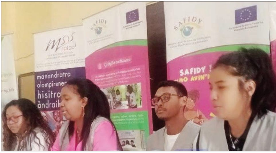
Ireo avy amin'ny Safidy nitafa tamin'ny mpanao gazety.

Tsy feno ny fepetra hisian'ny fifidianana amin'ny 16 novambra ho avy izao, hoy ny mpanara-maso ny fifidianana Safidy. Nambaran'ny tamin'ny tafa tamin'ny mpanao gazety omaly, fa tsy feno ny fepetra hisian'ny fifidianana malalaka, marina sy eken'ny rehetra amin'ny fanatanterahana ny fihodinana voalohany amin'ny alakamisy 16 novambra ho avy izao, manoloana ny toedraharaham-pirenena misy ankehitriny, hoy ity Sampana Fanarahamaso ny Fifidianana, lvon'ny Demokrasia Ifarimbomana na ny Safidy ity. Tsy mamela ny olom-pirenena hanao safidy mazava ny zava-misy ankehitriny, miampy ny fitomboan'ny tsy