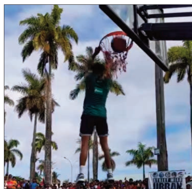
Dunk tany Toamasina.