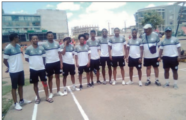
Ny mpikambana ao amin'ny Fc Copain teny Alarobia.

Tonga dia raikitra nanomboka tamin'ny alahady 12 novambra teo teny amin'ny kianjan'ny « Travaux publiques Alarobia », ny fifaninanana baolina kitra « Tournoi Open Foot à 7 » karakarain'ny ekipam-pokontany Fc Copain Alarobia Amboniloha tarihan'ny filohan'ny fanamarihana ny faha-18 taonany amin'ity taona 2023 ity. Nambaran'ity filohan'ny Fc Copain ity teny Alarobia tamin'io alahady io fa ekipa avy amin'ny faritra maro eto andrenivohitra sy ny manodidina azy miisa 34 ankehitriny no efa namaly ny antso raha ekipa 64 no vinavinaina handray anjara amin'ity fifaninanana ity. Mbola misokatra ny fisoratana anarana hoan'izy liana mbola handray anjara amin'ny fifaninanana, hoy hatrany Atoa Hasina, ary notsiahiviny ihany koa fa omby tena mifahy lehibe no hatolotra izay ho tafavoaka ho mpandresy amin'ity fifaninanana ity. Voka-dalao andro voalohany : US Prom 2 - 0 FC 2AM, Rover 0 - 0 Spartak, APMF 1 - 2 Together, Boca 3 - 1 EX-Sport, AJJ Ivato 1 - 2FC, ASDS 0 - 3 Celesao (par forfait), Famille Atsimo 0 - 0 AS IFFI, Tambatra 2 - 0 Red Star, Racing 2 - 1 Mahatony City. Teo amin'ny lalao fanokafana ofisialy ny hetsika nifanandrinan'ny Fc Copain topim-