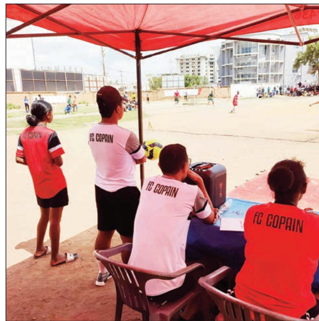
Fc Copain nanatrika ny fihaonana teny Alarobia.