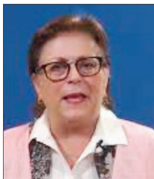
Ny Masoivohon'i Etazonia eto Madagasikara.

reneny. Na izany aza dia mampanahy anay ireo tatitra samihafa momba ny taham-pandraisana anjara ambany manerana an'i Madagasikara. Ny Masoivohon'i Etazonia sy ireo mpanara-maso iraisam-pirenena dia hitohy hanara-maso ny fanisambato sy hanaraka akaiky ny fivoaran'ny toe-draharaha. Na dia nisokatra arapotoana aza ny ankamaroan'ireo biraom-pifidianana dia mampanahy anay ny tsy fahampian'ireo mpikambana ao amin'ny birao fandatsaham-bato amin'ny toerana maro maro sy ny fiofanana izay nomena azy ireo. Ny Masoivohon'i Etazonia sy ireo mpanara-maso dia samy nitatitra tsy fahatomombanana tany amin'ny biraom-pifidianana, indrindra tamin'ny fihetsik'ireo solontenan'ny antoko po-