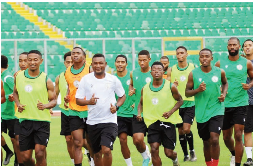
Mpilalaoan'ny Barea tany Kumasi.

Namaritana ny fivoaran'ireo mpilalao mandrafitra ny ekipan'ny Barea de Madagascar vaovao, ny lalao nifanandrinan'ny Black Stars de Ghana sy ny Barea de Madagascar tany amin'ny kianja "Stade BABA YARA - Kumasi Ghana" omaly zoma 17 novambra 2023. Nazava ny fanazavana nomen'ny Coach Rôro raha nanontanian'ireo mpanao gazety Malagasy manaradia ny delegasiona Malagasy, hiatrika ny fifaninana roa voalohany amin'ny fifanintsanana "Mondial 2026" izy, tamin'ny andro nialohan'ny fihonana tany Kumasi, raha nilaza fa niatrika ny lalao tamim-pahavononana ireo mpilalaoan'ny Barea rehetra ary niezaka araka izay tratra ny herin'izy ireo ry zareo ho fanomezam-