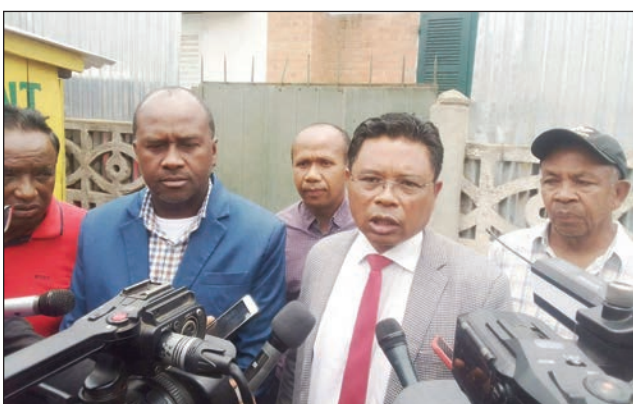
Ireo solontenan'ny vondron'ny kandidà, sy ireo depiote omaly, teny Fiadanana.