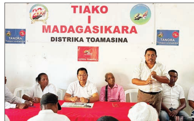
Ireo mpitarika ny antoko TIM any Toamasina.