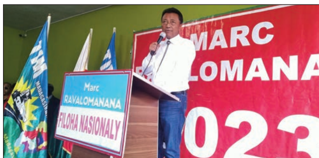
Ny filoha Marc Ravalomanana tetsy Bel'Air omaly.