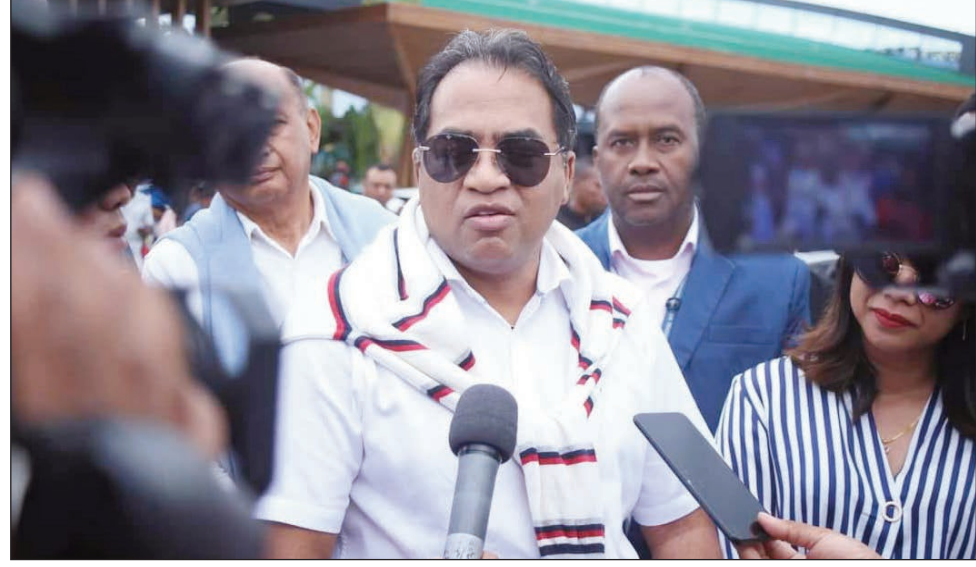
Ny Vovonana PAN/FFKM, nanao fanambarana teny Tsimbazaza ny alakamisy hariva teo.