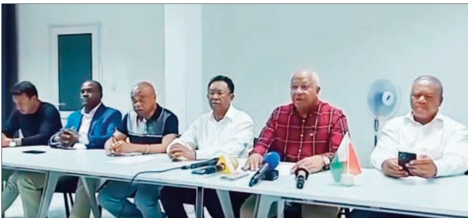
Ny vondron'ny kandidà nanao fanambarana.

Nanao fanambarana ny vondron'ireo kandidà ny alakamisy hariva teo fa mitohy ny tolona, miantso ny sivily sy miaramila koa izy ireo hijoro. Nambaran'ny solontenan'ireo vondron'ny kandidà nandritra izany fa very ny fitokisan'ny Malagasy ny mpikarakara ny fifidianana. Manamafy ny fitakiana ny hisian'ny fifidianana madio hatrany ny vondron'ny Kandidà, izay nilaza fa tsy maintsy mitohy ny tolona. Fandresena voalohan'ny tolona ny taham-pahavitrihana ambany indrindra tamin'ny tantaran'ny Firenena, ho an'ny fifidianana amboetra sy barofo, izay tsy