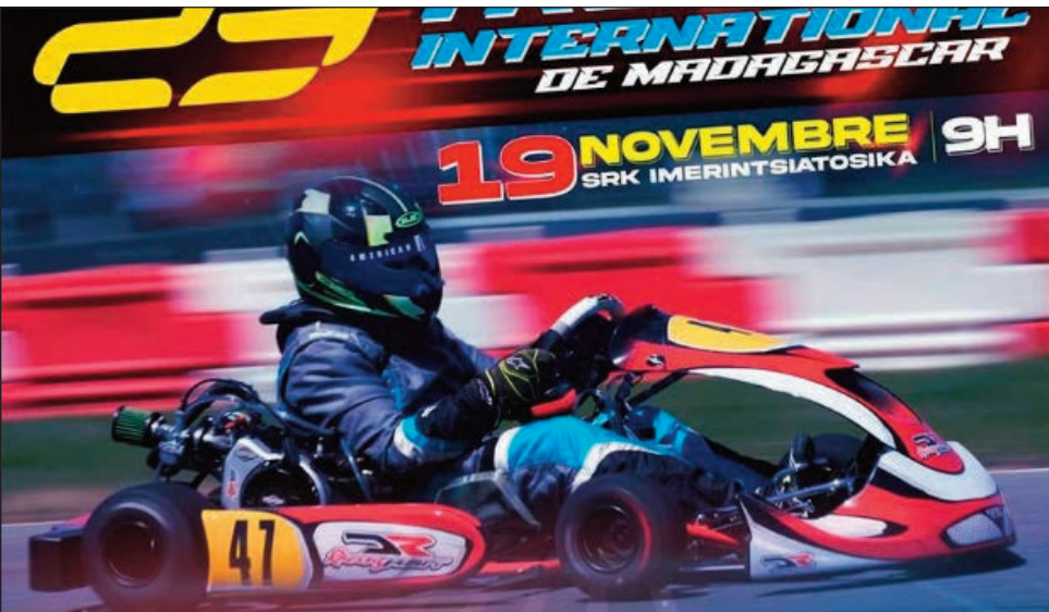
23e Trophée International de Madagascar.