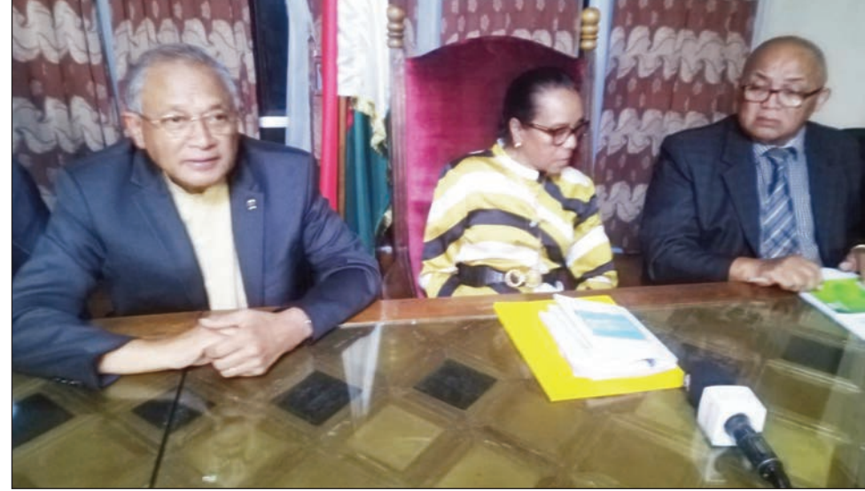
Ny avy amin'ny TIM Toamasina nanao fivoriambe ny alarobia teo, mitsipaka ny fifidianana tsy madio sy natao amboletra.