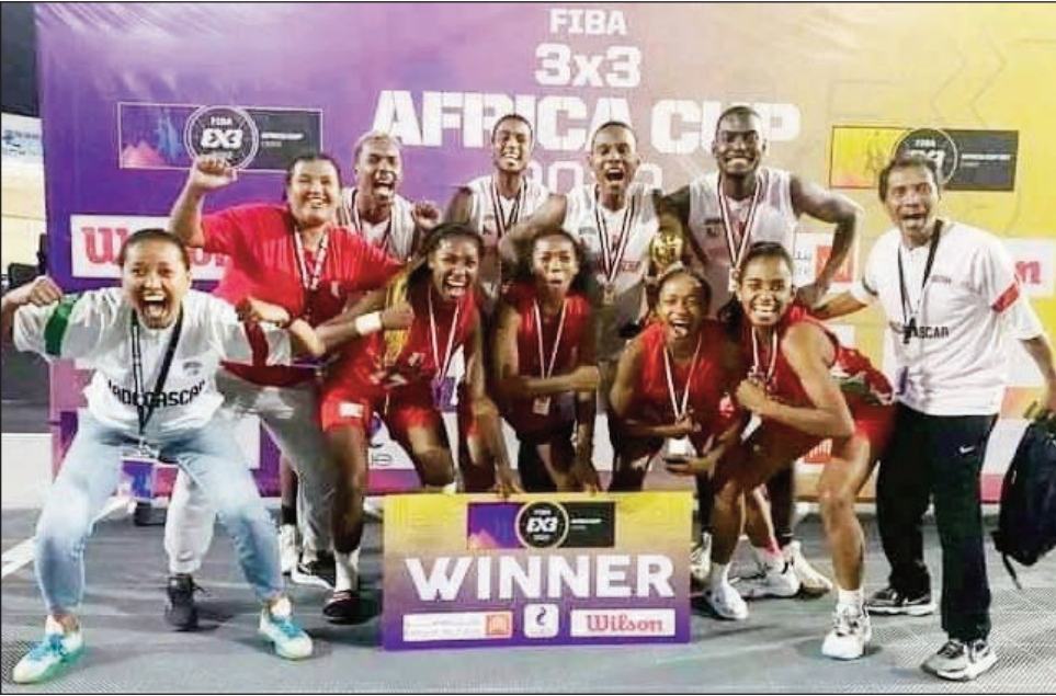
Ankoay lahy sy vavy 2022.

triny ny fizaram-bondrona lahy sy vavy amin'ity fifinanana ity, ka hoan'ny Ankoay vehivavy dia ao amin'ny vondrona B miaraka amin'i Kenya, Bénin, Maroc ary Nigéria no misy azy ireo. Ao amin'ny vondrona A kosa no misy an'i Egypte mpampiantrano, Ouganda, Algérie, Mali ary Sénégal. Hoan'ny Ankoay lehilahy kosa dia ao amin'ny vondrona B ihany koa miaraka amin'i Bénin, Kenya, Maroc ary Mali no misy azy ireo. Ho an'ny vondrona A amin'ity sokajy ity dia ahitana an'i Egypte mpampiantrano, Algérie, Ouganda, Sénégal ary Nigéria. Tsihivina fa i Madagasikara sokajy lehilahy sy Egipte sokajy vehivavy no tompondaka farany tamin'ity fifinanana ity. Tompondaka lefitra kosa i Madagasikara tamin'io andiany faha-4 farany io.