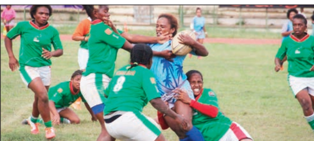
Rugby vehivavy Malagasy.

Hitohy etsy amin'ny kianjan'i Makis Andohatapenaka indray, ny fifaninana rugby vehivavy, fiadiana ny ho tompondakan'i Madagasikara sokajy D-1 sy D-2, 2023 amin'ny alahady 19 novambra 2023 ho avy izao araka ny fandaharandala. 09:00-Uasc Cheminot # Fanja Anjanahary,